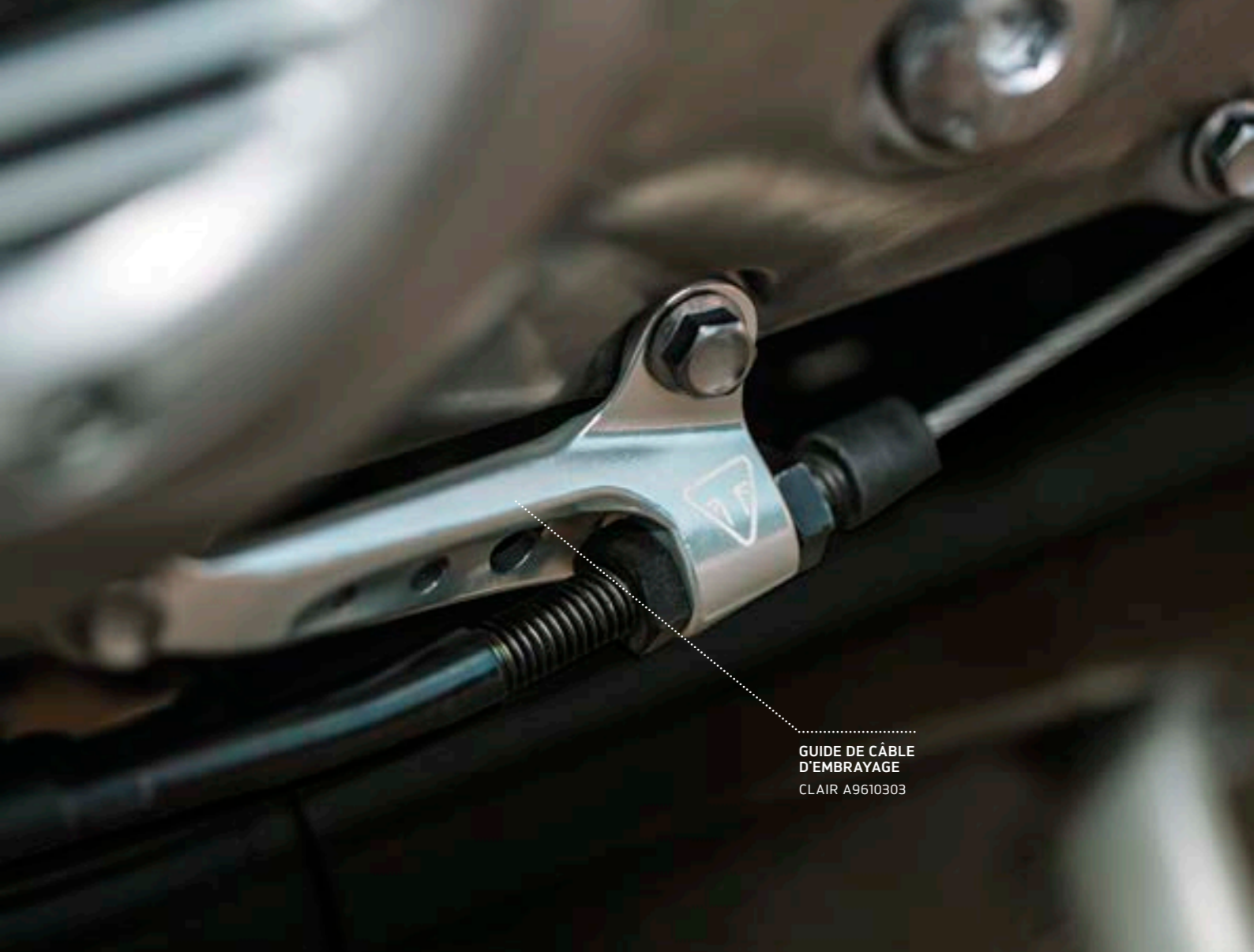
GUIDE DE CÂBLE D'EMBRAYAGE CLAIR A9610303