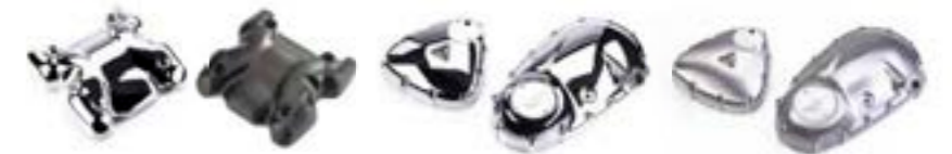
KIT CACHE-ARBRE À CAMES CHROMÉ A9618150 NOIR A9618197