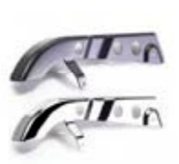
PARE-CHAÎNE CHROMÉ A2055009 BLACK A2055008