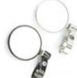
RÉTROVISEUR EMBOUT DE GUIDON ARRONDI (70 MM) NOIR A9638136 CLAIR A9638137