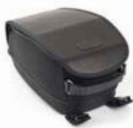
SACOCHÉ DE RÉSERVOIR EN COTON CIRÉ NOIR A9518100