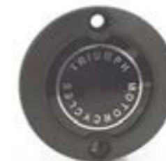
ÉCUSSON D'ALTERNATEUR NOIR A9610265