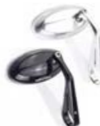
RÉTROVISEUR EMBOUT DE GUIDON NOIR ANODISÉ A9630205 CLAIR ANODISÉ A9630206