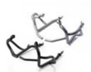
BARRES DE PROTECTION MOTEUR NOIR A9788025 GRAPHITE A9788026