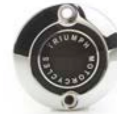
ÉCUSSON D'ALTERNATEUR CHROMÉ A9610263