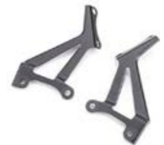
KIT DE MONTAGE DE PARE-BRISE A9708434