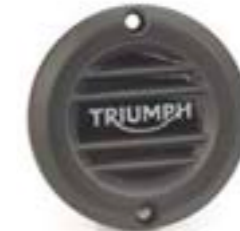
ÉCUSSON D'EMBRAYAGE NERVURÉ NOIR A9610253