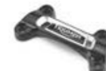
PONTET DE GUIDON 28,5 MM A2041638