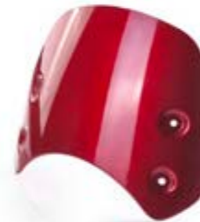
PARE-BRISE COURT PEINT A9708381