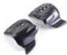
COUVERCLES D'ADMISSION NOIR A9618182