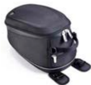
SACOCHÉ DE RÉSERVOIR EN NYLON A9518091