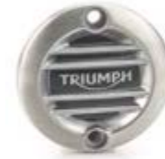
ÉCUSSON D'ALTERNATEUR NERVURÉ BROSSÉ A9610260