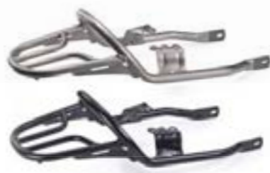
PORTE-BAGAGES NOIR A9758179 GRAPHITE A9758304