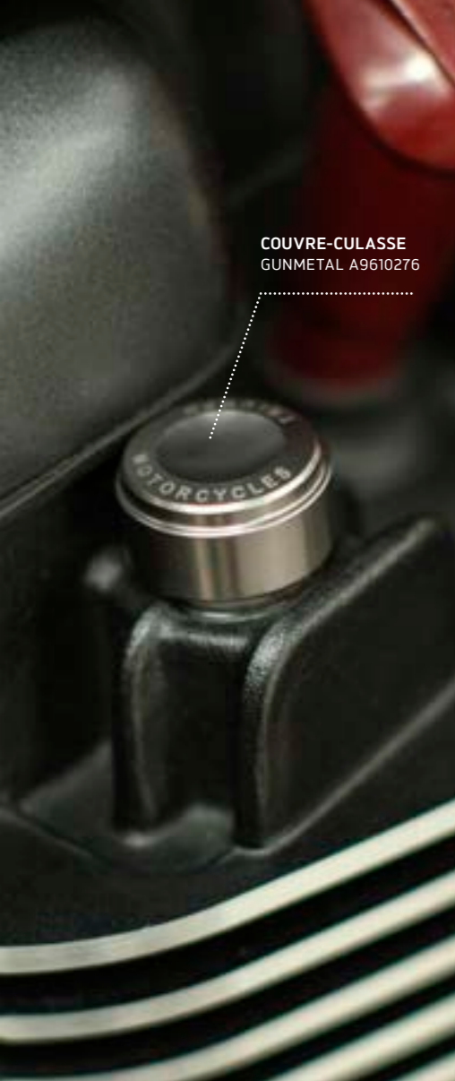
COUVRE-CULASSE GUNMETAL A9610276