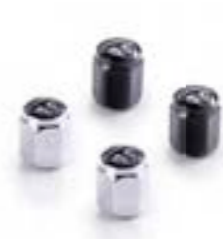
BOUCHONS DE VALVE CAPUCHON DE VALVE ÉCUSSON CHROMÉ A2009007 CAPUCHON DE VALVE ÉCUSSON NOIR A2009037