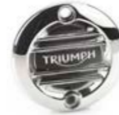
ÉCUSSON D'ALTERNATEUR NERVURÉ CHROMÉ A9610259