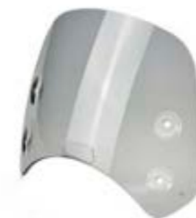
PARE-BRISE COURT TEINTÉ CLAIR A9708407