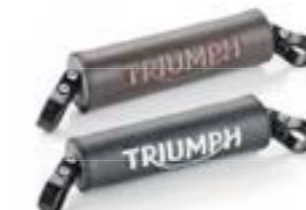
BARRE DE RENFORT DE GUIDON NOIR A9638142 MARRON A9638144