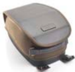
SACOCHÉ DE RÉSERVOIR EN COTON CIRÉ VERT OLIVE A9518089