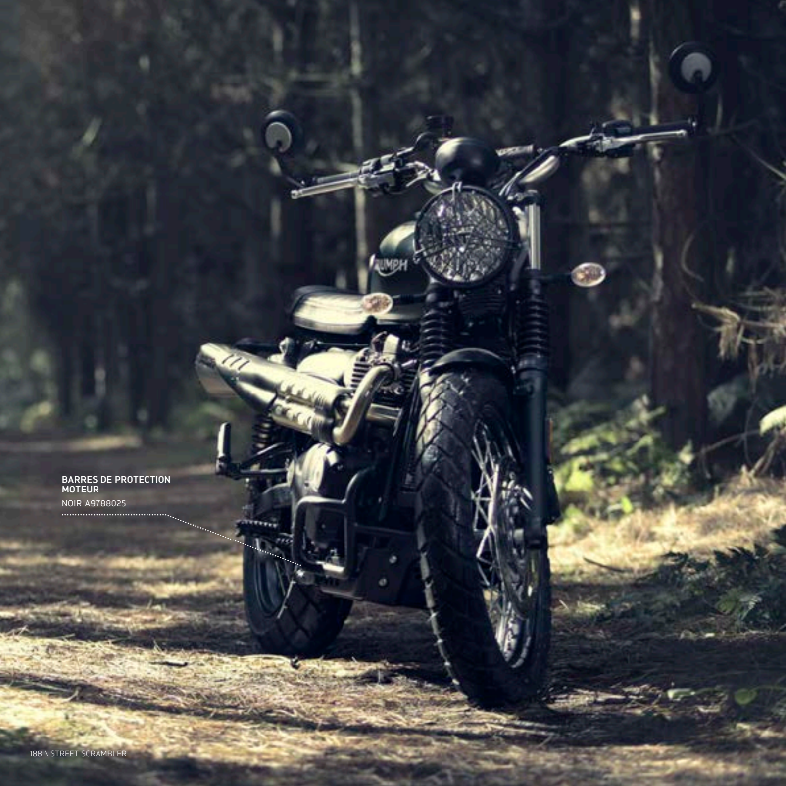
BARRES DE PROTECTION MOTEUR NOIR A9788025