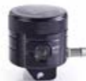
RÉSERVOIR DE FREIN USINÉ CNC AVANT A9628043