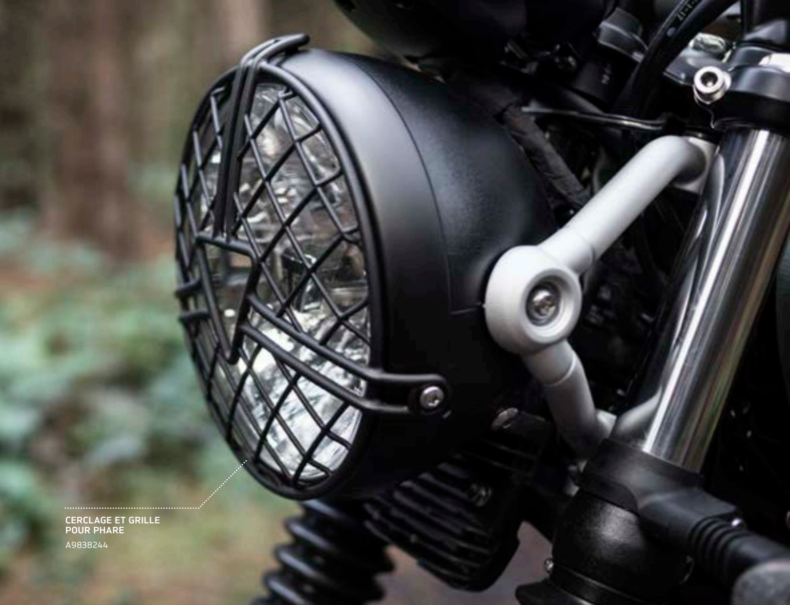
CERCLAGE ET GRILLE POUR PHARE A9838244