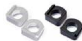
DISPOSITIF DE RÉGLAGE DE ROUE ARRIÈRE NOIR A9648046 GRIS A9648047