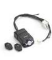
KIT ALARME A9808110