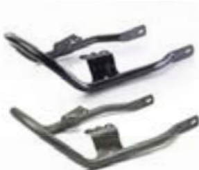
POIGNÉE PASSAGER NOIR A9758292 GRAPHITE A9758305