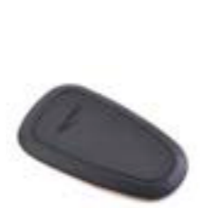
PATIN DE RÉSERVOIR A9798027