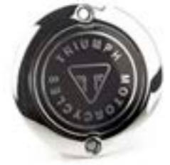
ÉCUSSON D'EMBRAYAGE CHROMÉ A9610255