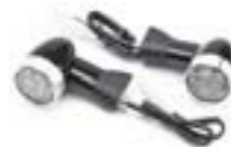
CLIGNOTANT À LED FUSÉLÉ AVANT 40 MM TIGE COURTE A9838023 A9838039