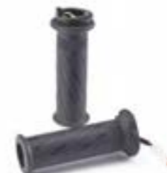
POIGNÉES CHAUFFANTES A9638145