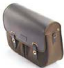
SACOCHÉ LATÉRALE EN COTON CIRÉ, CÔTÉ GAUCHE VERT OLIVE A9518176