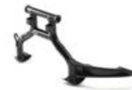
BÉQUILLE CENTRALE A9778045