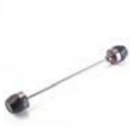
PROTECTIONS DE FOURCHE A9640099