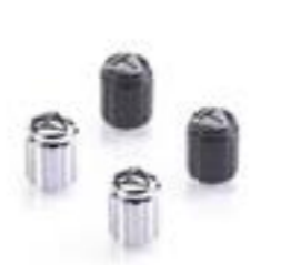
BOUCHONS DE VALVE CHROMÉ GRAVURE LASER A2009006 NOIR GRAVURE LASER A2009036