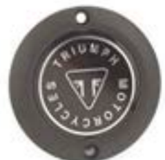
ÉCUSSON D'EMBRAYAGE NOIR A9610257