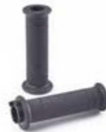
POIGNÉE DE GUIDON CROISILLONS 22,2 MM NOIR A2041476