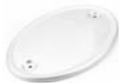
PLAQUE PORTE-NUMERO A9708431