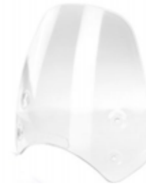
PARE-BRISE HAUT CLAIR A9708408