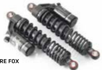
AMORTISSEUR ARRIÈRE FOX A9640208