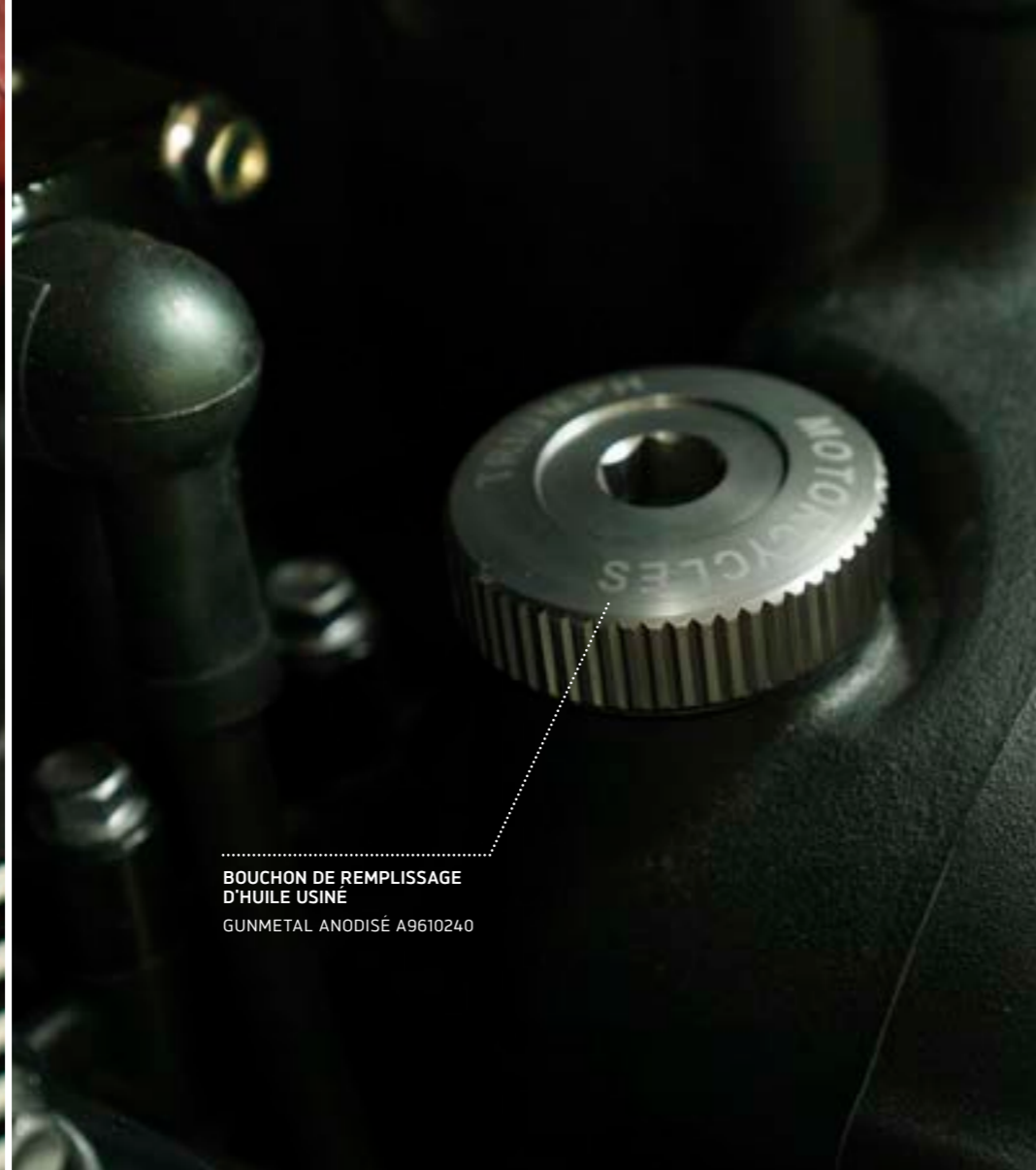
BOUCHON DE REMPLISSAGE D'HUILE USINÉ GUNMETAL ANODISÉ A9610240