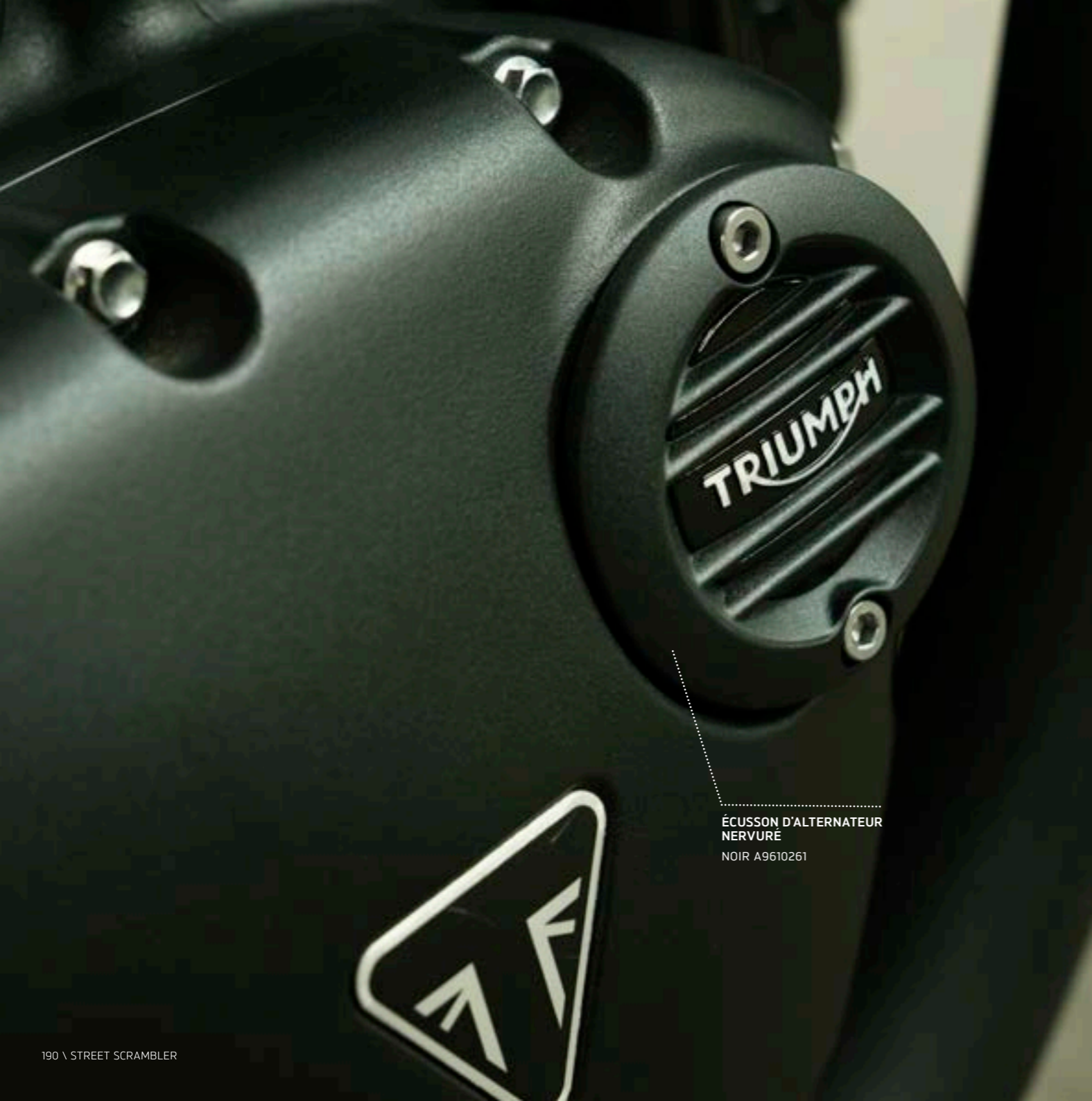
ÉCUSSON D'ALTERNATEUR NERVURÉ NOIR A9610261