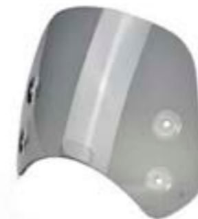
PARE-BRISE COURT TEINTÉ SOMBRE A9708151