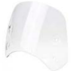
PARE-BRISE COURT CLAIR A9708303