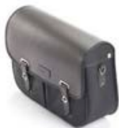
SACOCHÉ LATÉRALE EN COTON CIRÉ, CÔTÉ GAUCHE NOIR A9518177