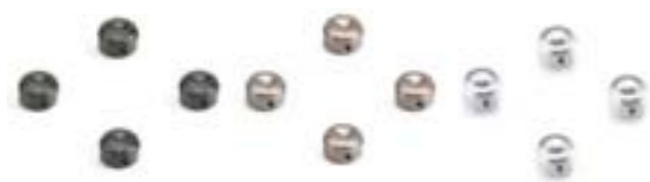
COUVRE-CULASSE NOIR A9610275 GUNMETAL A9610276 ARGENT A9610277