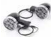
CLIGNOTANT À LED FUSÉLÉ AVANT 64 MM TIGE COURTE A9838028 A9838036