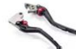
LEVIERS RÉGLABLES A9628054