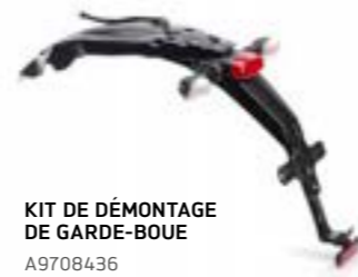
KIT DE DÉMONTAGE DE GARDE-BOUE A9708436