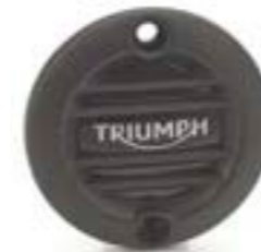
ÉCUSSON D'ALTERNATEUR NERVURÉ NOIR A9610261