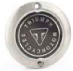
ÉCUSSON D'EMBRAYAGE BROSSÉ A9610256