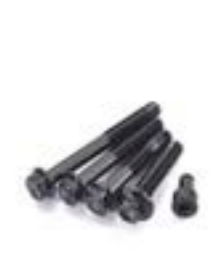
FIXATIONS DE CARTERS NOIR A9618190