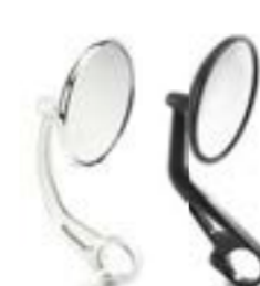
RÉTROVISEUR EMBOUT DE GUIDON ARRONDI CLAIR A9638132 NOIR A9638133