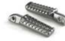
REPOSE-PIEDS PASSAGER A9770148