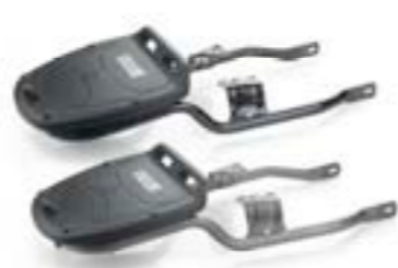
KIT DE FIXATION NOIR A9758306 A9758307