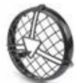
CERCLAGE ET GRILLE POUR PHARE A9838244