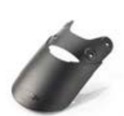
EXTENSION DE GARDE-BOUE A9708405