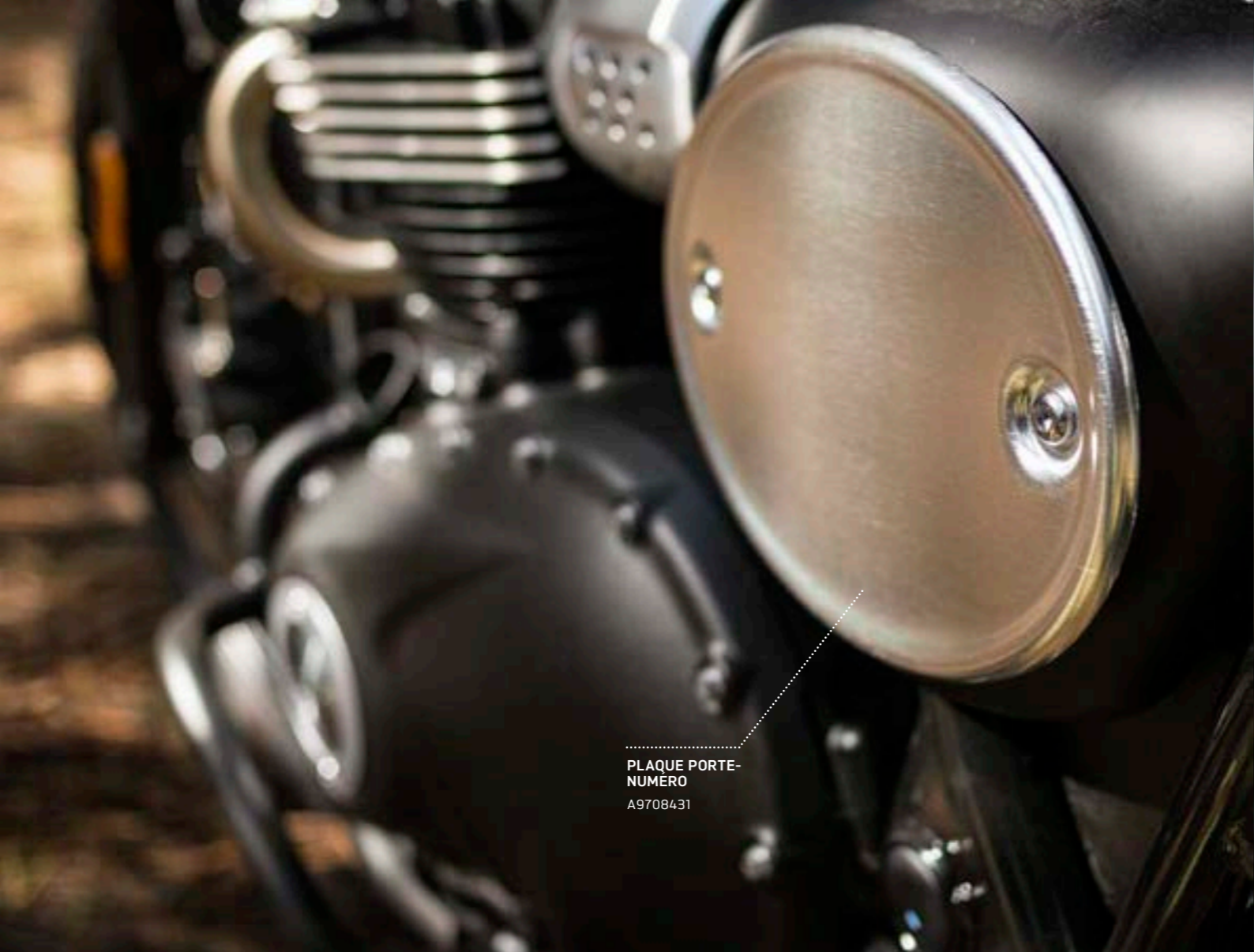
PLAQUE PORTE-NUMERO A9708431