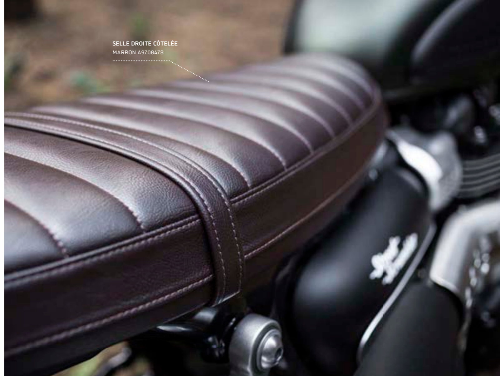
SELLE DROITE CÔTELÉE MARRON A9708478