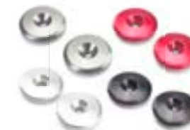
EMBOUS DE GUIDON NOIR A9630437 CLAIR ANODISÉ A9630438 ROUGE A9630439 GRIS A9630440