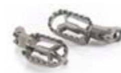
REPOSE-PIEDS PILOTE A9770172