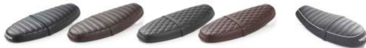
SELLE DROITE CÔTELÉE NOIR A9708476 MARRON A9708478