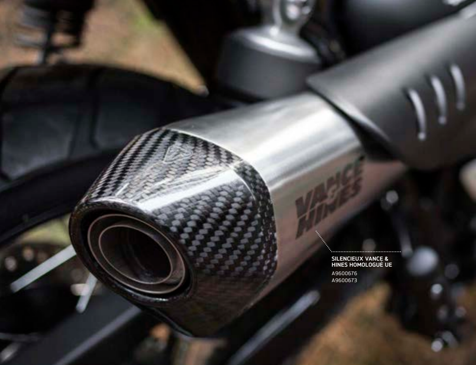
SILENCIEUX VANCE & HINES HOMOLOGUÉ UE A9600676 A9600673