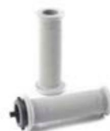
POIGNÉE DE GUIDON CROISILLONS 22,2 MM GRIS A2041477