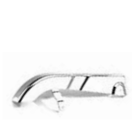
PARE-CHAÎNE CHROMÉ A9640096