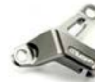
KUPPLUNGSZUGFÜHRUNG GUNMETAL GREY, ELOXIERT, A9610061 RED, ELOXIERT, A9610062