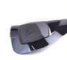
SITZBANKABDECKUNG A9708133 - ##