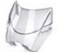
FLYSCREEN ZUSATZSCHEIBE A9708266