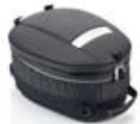
TANKRUCKSACK MIT SCHNELLVERSCHLUSS A9510410