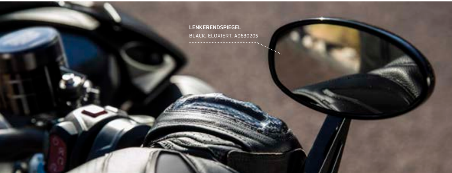
LENKERENDSPIEGEL BLACK, ELOXIERT, A9630205