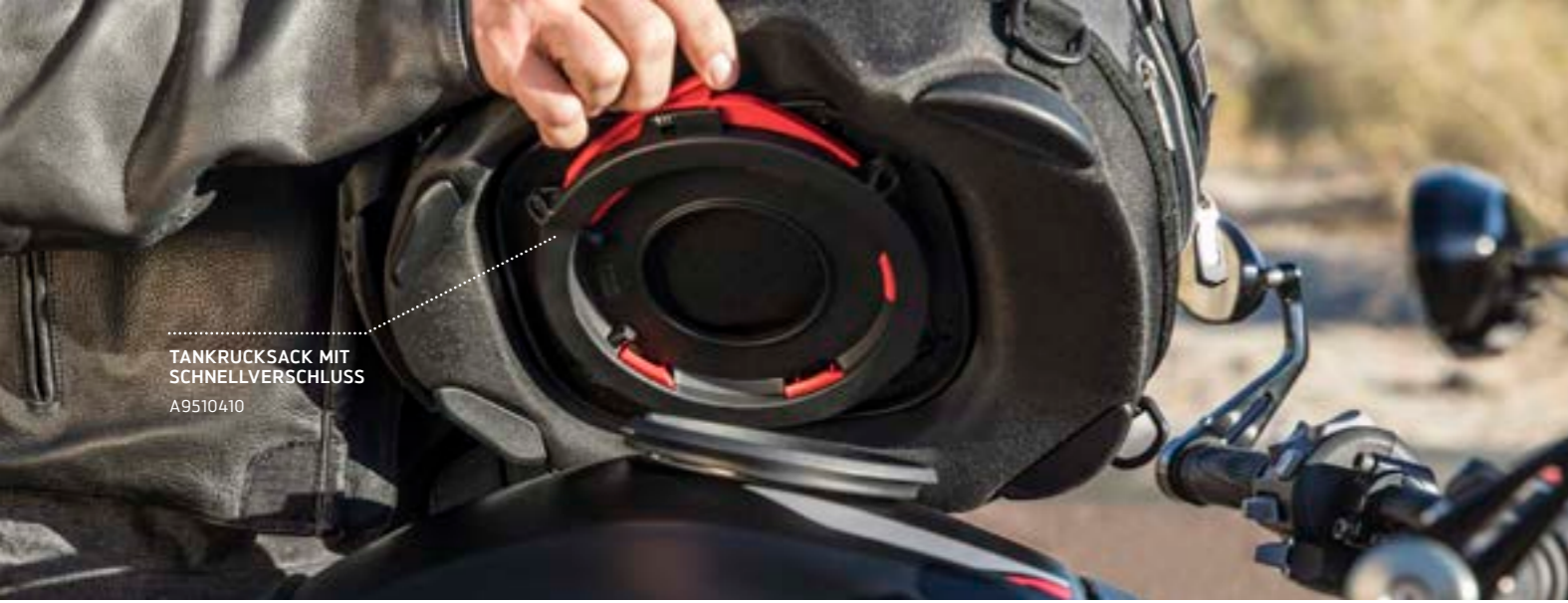
TANKRUCKSACK MIT SCHNELLVERSCHLUSS A9510410