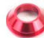
GUIA DE CABO DE EMBREAGEM GUNMETAL CINZA ANODIZADO A9610061 VERMELHO ANODIZADO A9610062