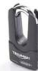
TRAVA DE DISCO A9810021