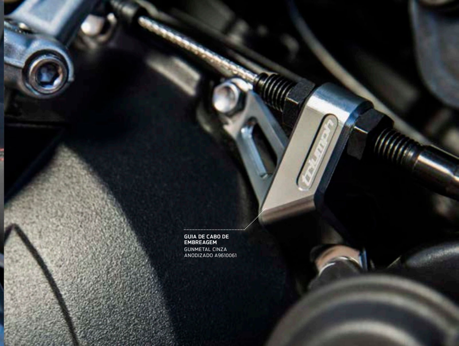
GUIA DE CABO DE EMBREAGEM GUNMETAL CINZA ANODIZADO A9610061