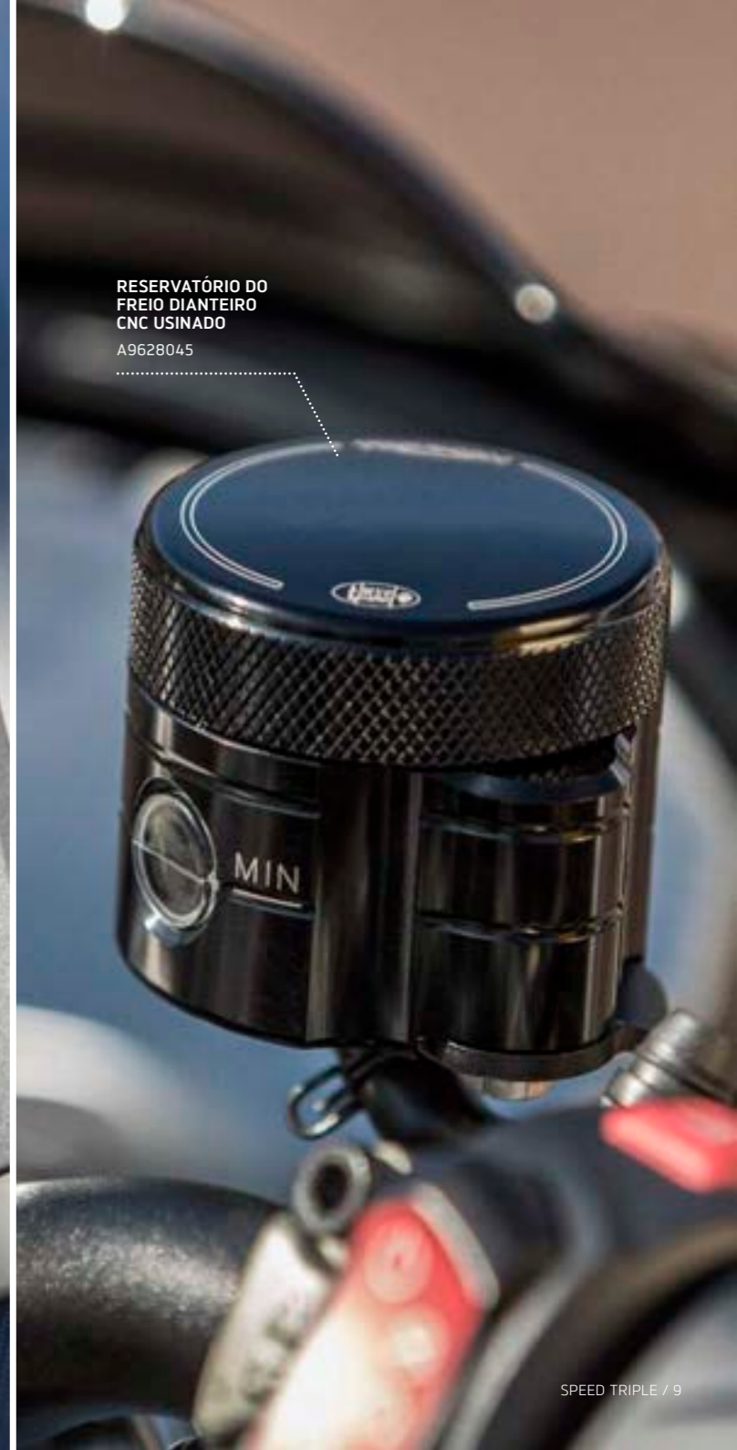
RESERVATÓRIO DO FREIO DIANTEIRO CNC USINADO A9628045