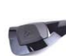
PROTEÇÃO DE ASSENTO A9708133 - ##