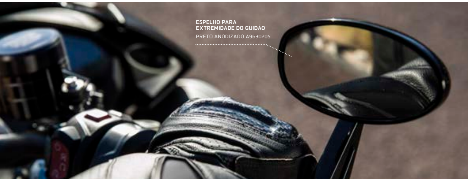
ESPELHO PARA EXTREMIDADE DO GUIDÃO PRETO ANODIZADO A9630205