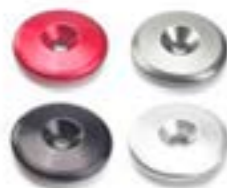
ACABAMENTOS PARA EXTREMIDADE DO GUIDÃO PRETO ANODIZADO A9630437 TRANSPARENTE ANODIZADO A9630438 VERMELHO ANODIZADO A9630439 GUNMETAL CINZA ANODIZADO A9630440