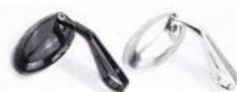
ESPELHO PARA EXTREMIDADE DO GUIDÃO PRETO ANODIZADO A9630205 TRANSPARENTE ANODIZADO A9630206