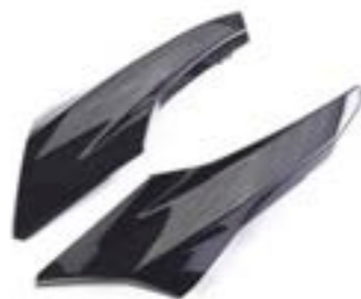
CARENAGEM INFERIOR A9708119 - ##