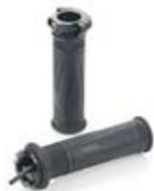
MANOPLAS AQUECIDAS A9638180