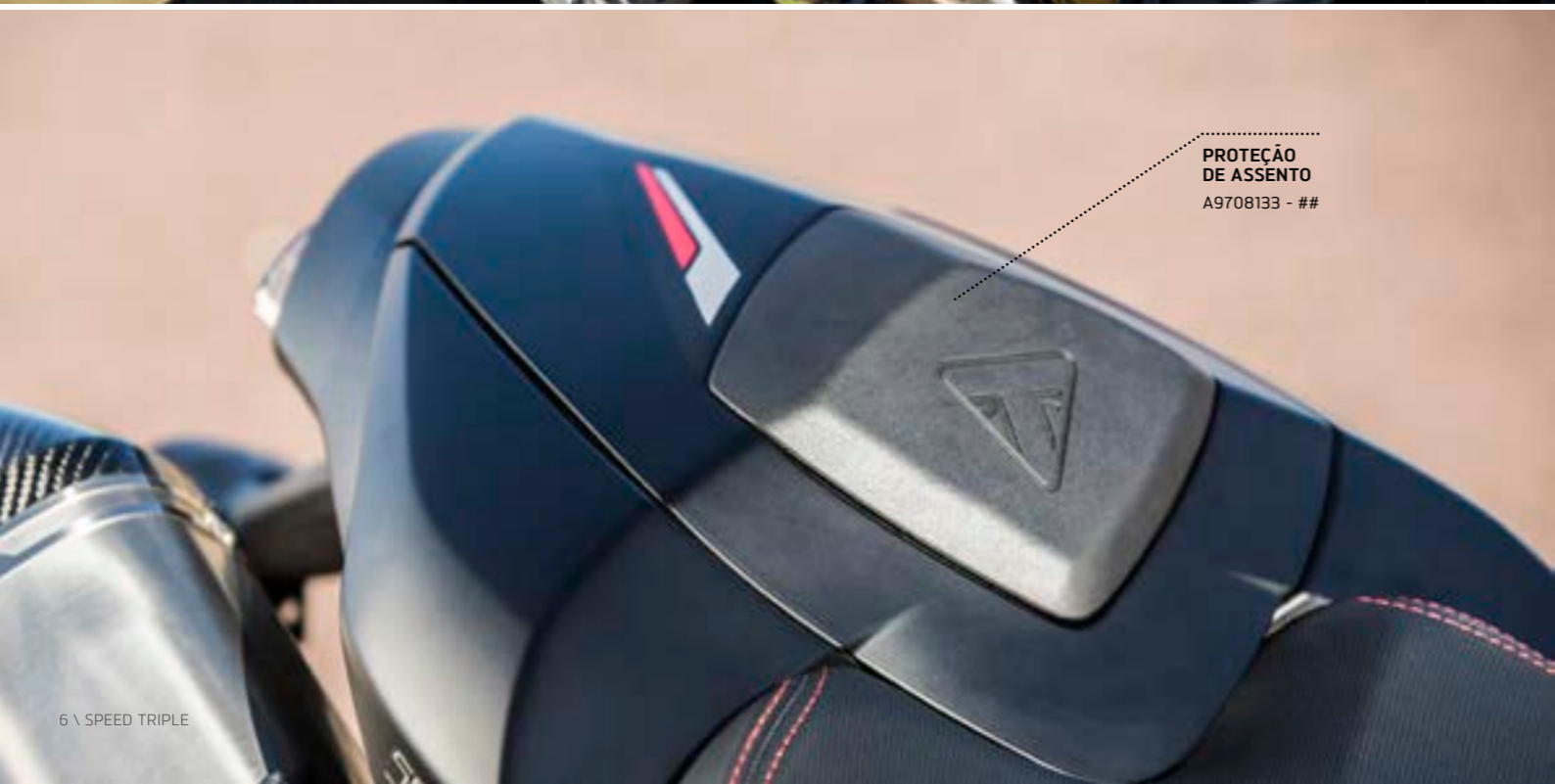
PROTEÇÃO DE ASSENTO A9708133 - ##