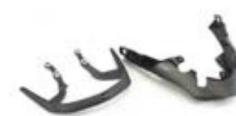
ALÇA PARA O PASSAGEIRO A9758293