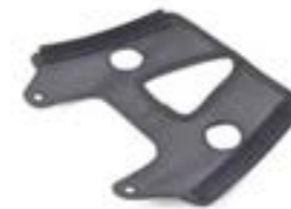
SUPORE PARA MALA TRASEIRA A9510164