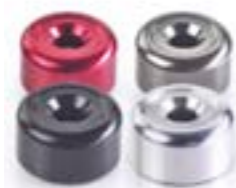
ACABAMENTO PARA EXTREMIDADE DO GUIDÃO TRANSPARENTE ANODIZADO A9630431 PRETO ANODIZADO A9630367 VERMELHO ANODIZADO A9630432 GUNMETAL CINZA ANODIZADO A9630434