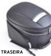
MALA TRASEIRA A9510249