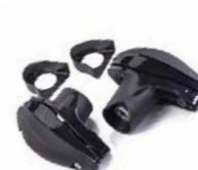
PROTEÇÃO DE ESTRUTURA A9788016