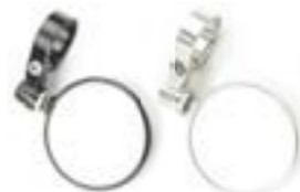
ESPELHO DE EXTREMIDADE REDONDO (70 MM) PRETO ANODIZADO A9638136 TRANSPARENTE ANODIZADO A9638137