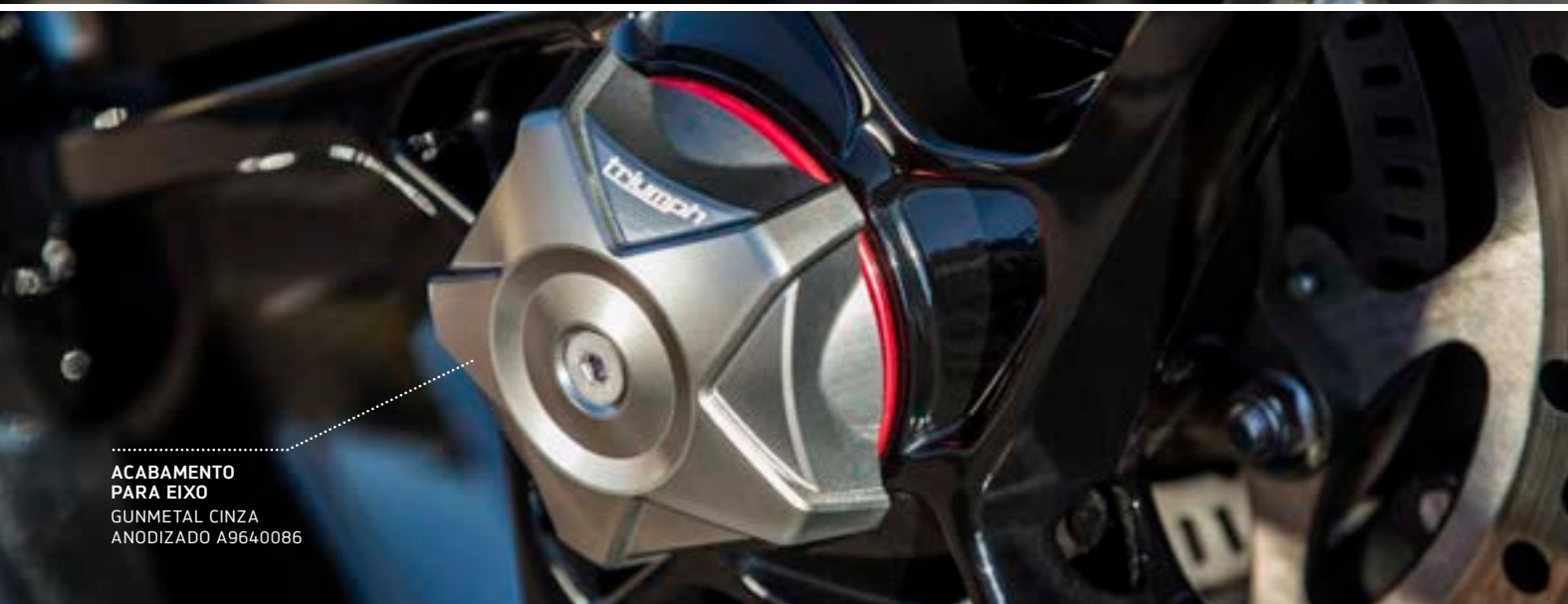
ACABAMENTO PARA EIXO GUNMETAL CINZA ANODIZADO A9640086