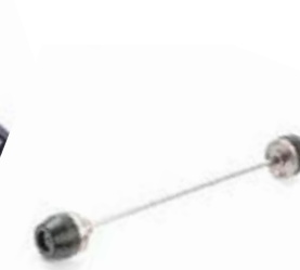
PROTEÇÕES DE FORQUETA A9640080