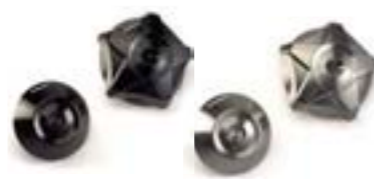
ACABAMENTO PARA EIXO PRETO ANODIZADO A9640085 GUNMETAL CINZA ANODIZADO A9640086