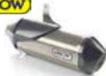
SILENCIADOR ARROW EU A9600832 NÃO HOMOLOGADO PARA O BRASIL