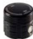
RESERVATÓRIO DO FREIO DIANTEIRO CNC USINADO A9628045