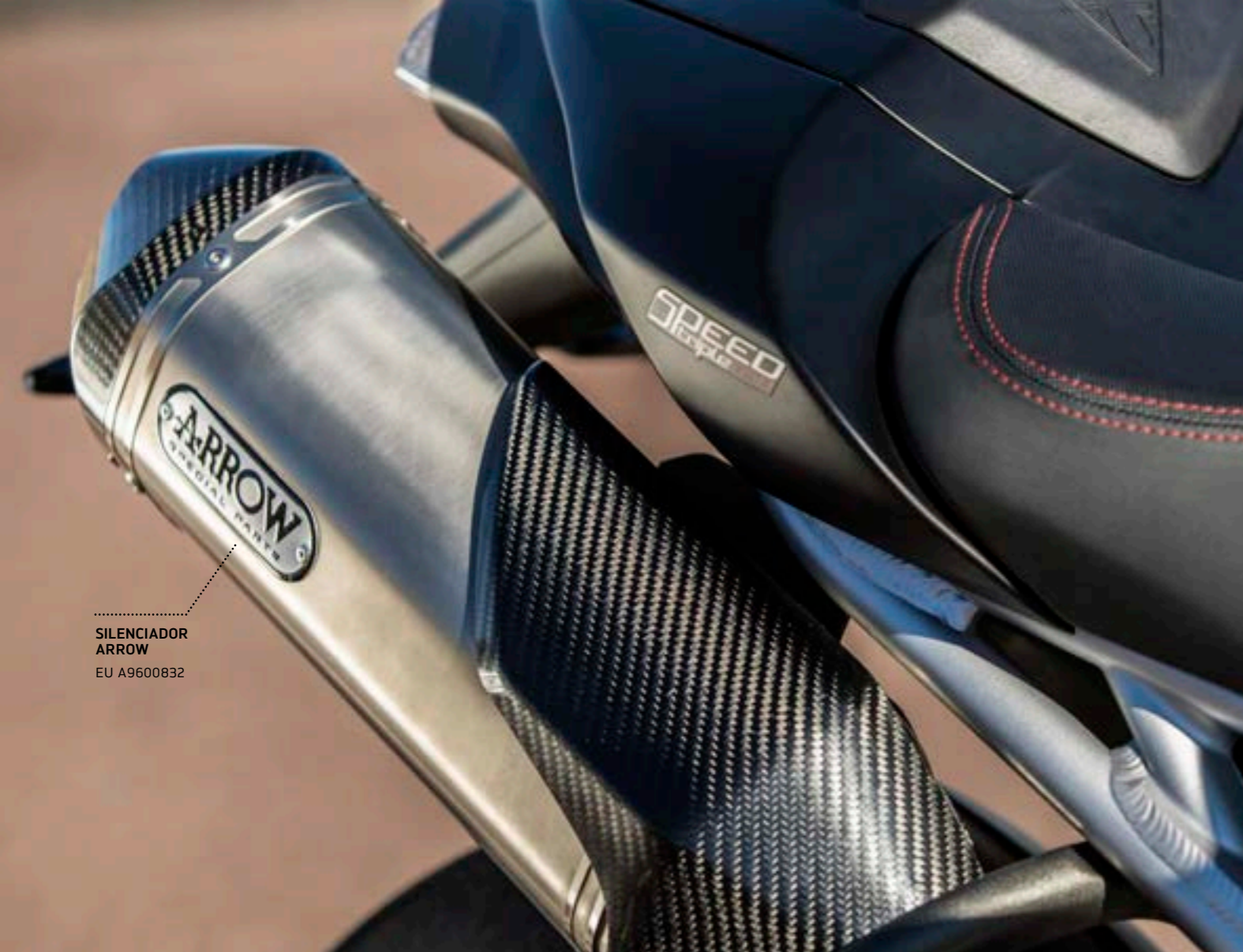
SILENCIADOR ARROW EU A9600832