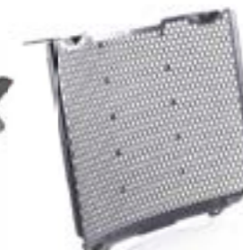
PROTEÇÃO DE RADIADOR A9708364