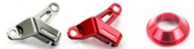
GUÍA DEL CABLE DE EMBRAGUE GRIS PLOMO ANODIZADO A9610061 ANODIZADO ROJO A9610062