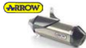
SILENCIADOR ARROW EU A9600832