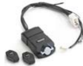
KIT DE ALARMA - APROBADO POR THATCHAM