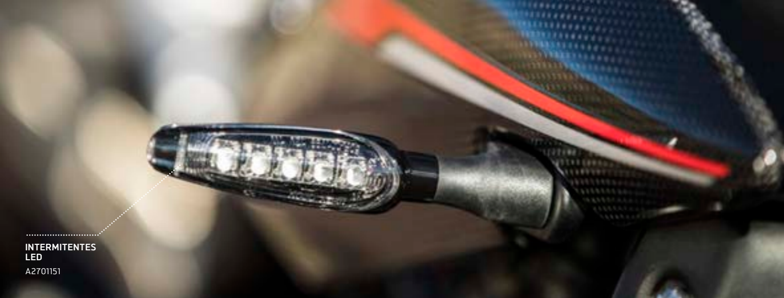
INTERMITENTES LED A2701151