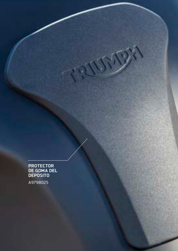
PROTECTOR DE GOMA DEL DEPÓSITO A9798025