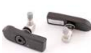
SISTEMA DE MONITORIZACIÓN DE PRESIÓN DE NEUMÁTICOS