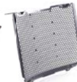
PROTECTOR DEL RADIADOR A9708364