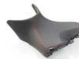
ASIENTO DEL PILOTO BAJO A2307128