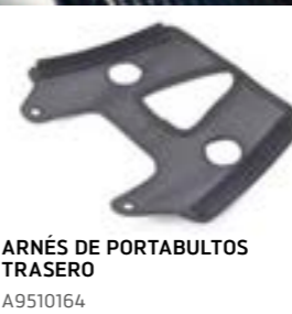
ARNÉS DE PORTABULTOS TRASERO A9510164