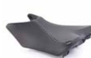
ASIENTO DEL PILOTO BAJO A2302994