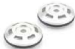
TAPAS DEL EJE DEL BASCULANTE A9640201