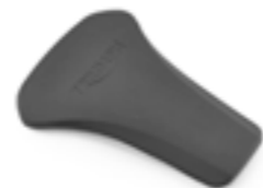
PROTECTOR DE GOMA DEL DEPÓSITO A9798025