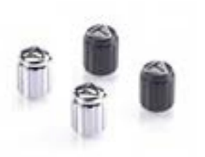
TAPONES DE VÁLVULA GRABADOS POR LÁSER

NUESTRO CONFIGURADOR LE PERMITE PERSONALIZAR CUALQUIERA DE LAS MOTOCICLETAS DE NUESTRA GAMA CON UNA AMPLIA CANTIDAD DE ACCESORIOS.