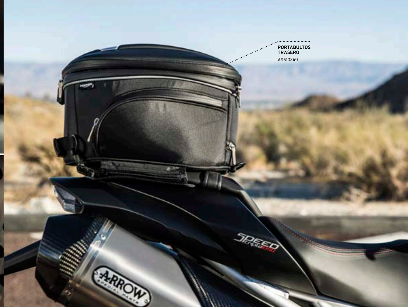
PORTABULTOS TRASERO A9510249