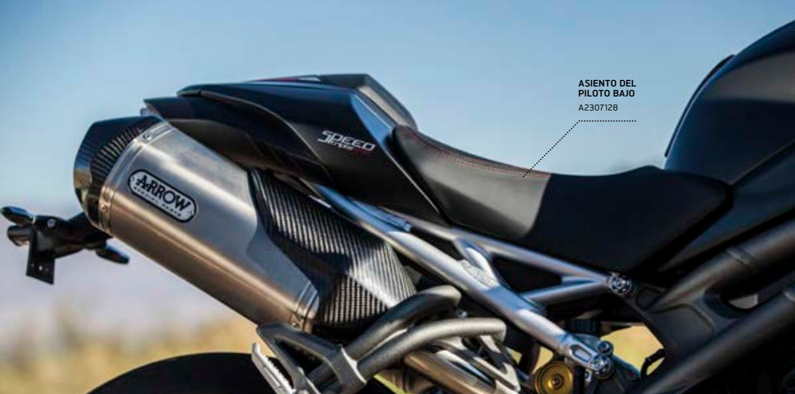
ASIENTO DEL PILOTO BAJO A2307128