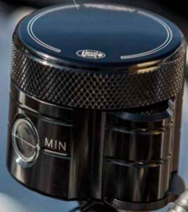
DEPÓSITO DEL FRENO MECANIZADO POR CNC A9628045