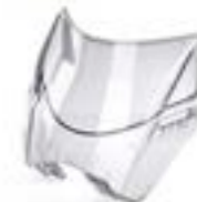
KIT DE VISOR ALTO DE CÚPULA A9708266