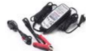
OPTIMIZADOR DE BATERÍA TRIUMPH