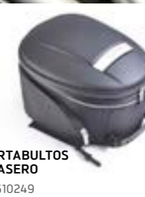
PORTABULTOS TRASERO A9510249