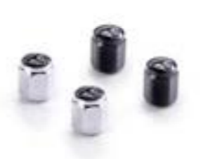
TAPONES DE VÁLVULA INSIGNIA EN BURBUJA