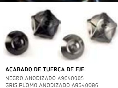
ACABADO DE TUERCA DE EJE NEGRO ANODIZADO A9640085 GRIS PLOMO ANODIZADO A9640086