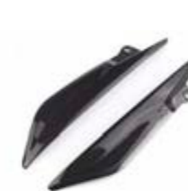
EMBELLECEDOR DE DEPÓSITO DE COMBUSTIBLE DE CARBONO A9708417