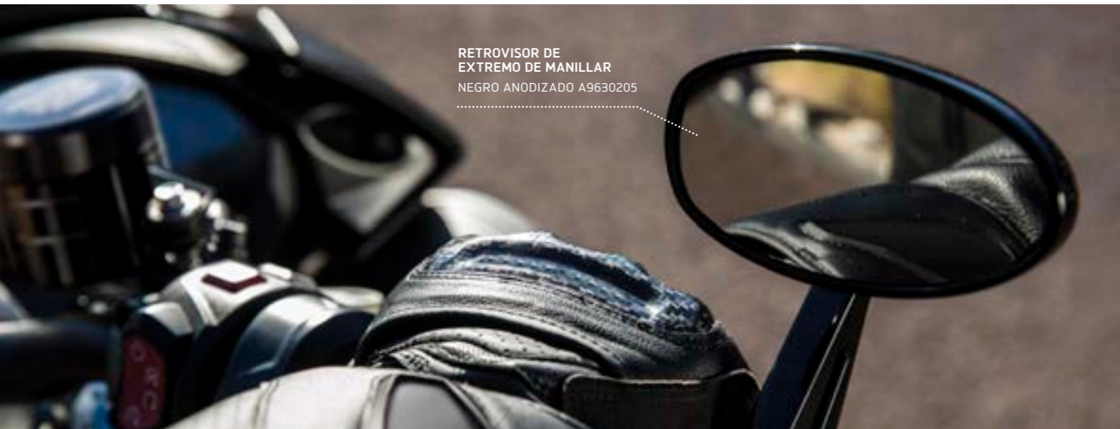
RETROVISOR DE EXTREMO DE MANILLAR NEGRO ANODIZADO A9630205