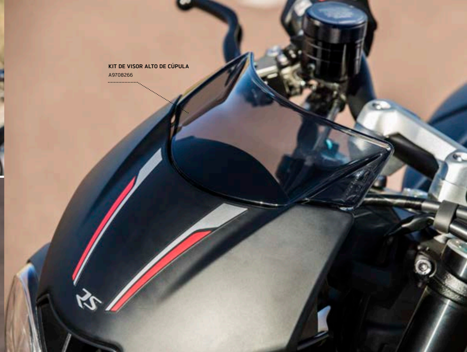
KIT DE VISOR ALTO DE CÚPULA A9708266