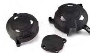
PROTEÇÃO DA TAMPA DO MOTOR A9618132