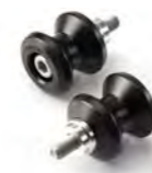
SUPORTE "PADDOCK" DE NYLON PRETO A9640022