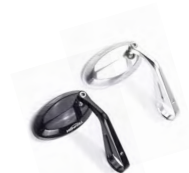
ESPELHO PARA EXTREMIDADE DO GUIDÃO PRETO ANODIZADO A9630205 TRANSPARENTE ANODIZADO A9630206