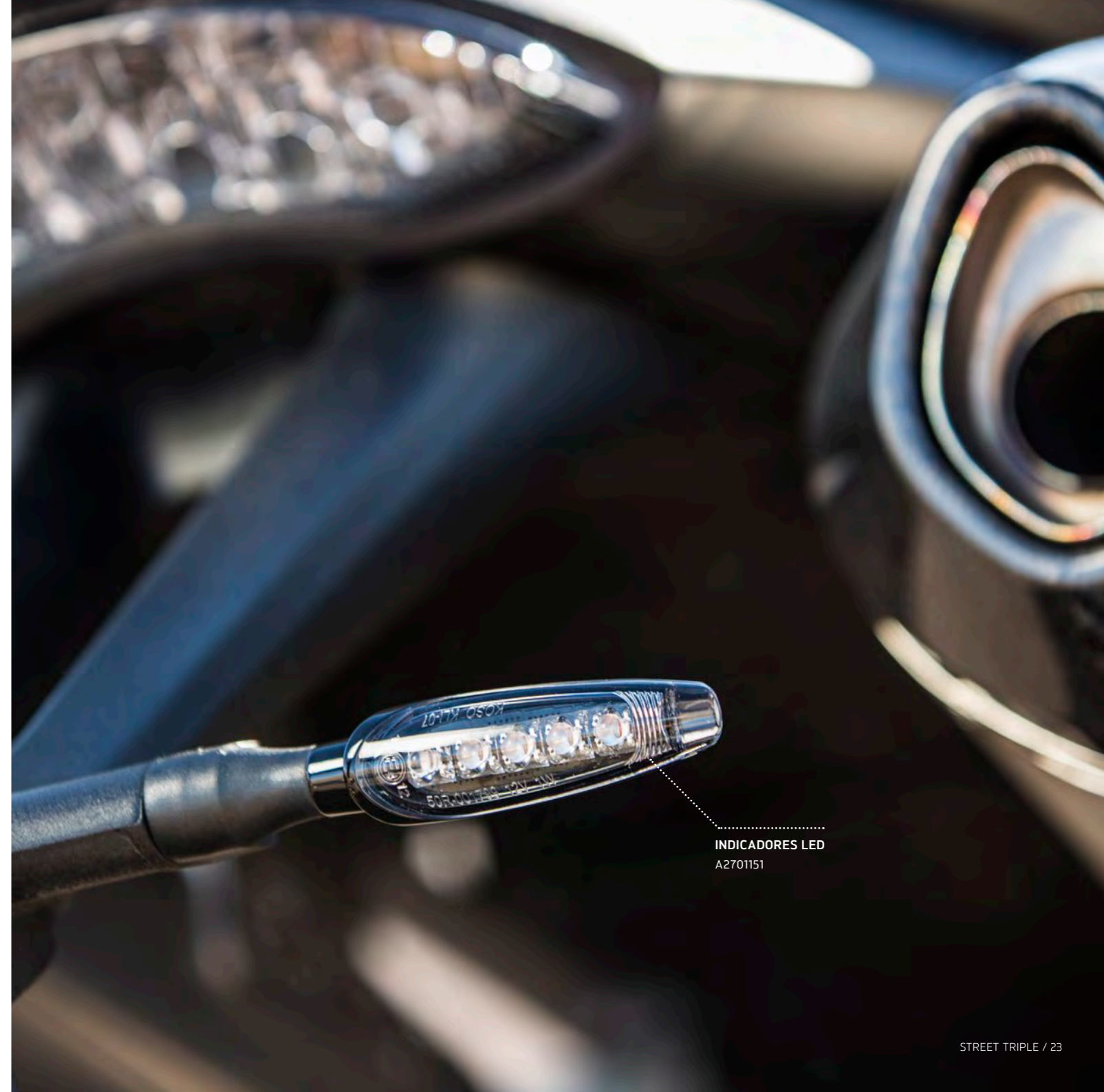
INDICADORES LED A2701151