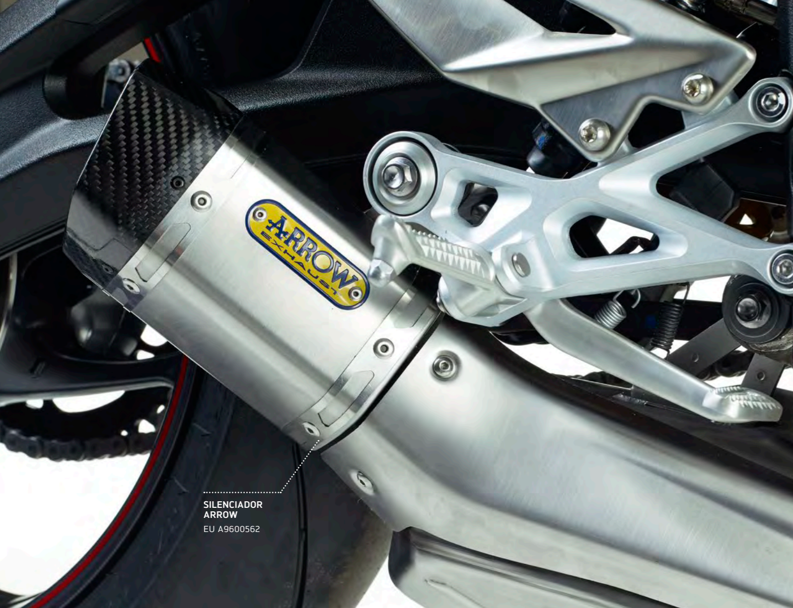
SILENCIADOR ARROW EU A9600562