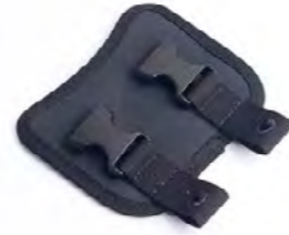
SUPORTE DE MONTAGEM DA BOLSA DE TANQUE A9518149