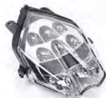
LANTERNA LED TRASEIRA TRANSPARENTE A9830116