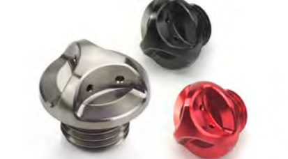
TAMPÃO DO ÓLEO USINADO GUNMETAL CINZA ANODIZADO A9610214 PRETO ANODIZADO A9610209 VERMELHO ANODIZADO A9610210