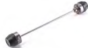
PROTEÇÕES DE FORQUETA A9640205