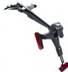
SUORTE PARA PLACA DA MOTO A9708391