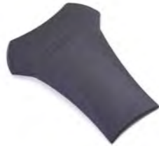
PROTEÇÃO DE TANQUE DE BORRACHA A9798029