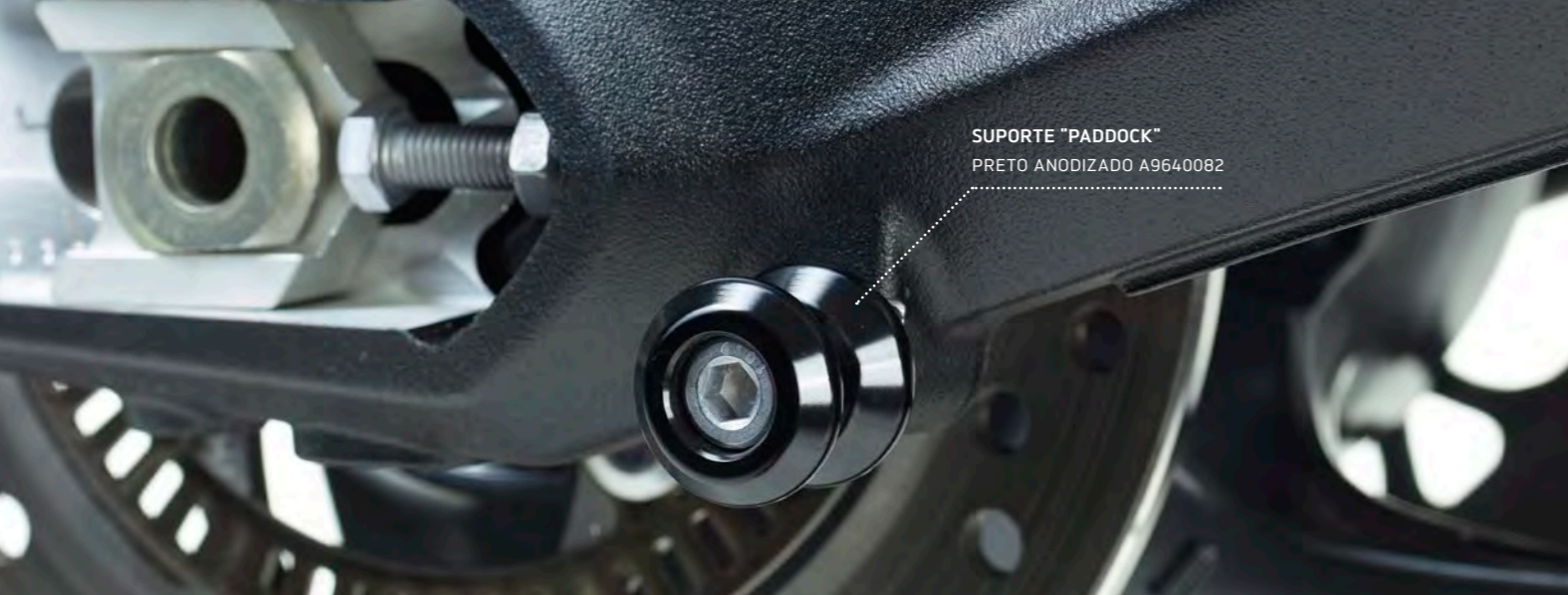
SUPORTE "PADDOCK" PRETO ANODIZADO A9640082