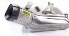
SILENCIADOR ARROW US A9600563