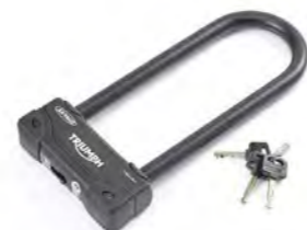
TRAVA EM U DE 270 MM A9810023