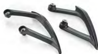
ALÇA PARA O PASSAGEIRO A9758298