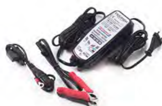
OTIMIZADOR DE BATERIA TRIUMPH UK A9930410 EU A9930411 NÃO HOMOLOGADO NO BRASIL