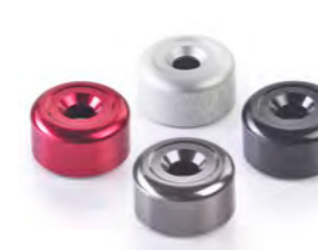
ACABAMENTOS PARA EXTREMIDADE DO GUIDÃO PRETO ANODIZADO A9630437 TRANSPARENTE ANODIZADO A9630438 VERMELHO ANODIZADO A9630439 GUNMETAL CINZA ANODIZADO A9630440