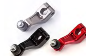
ATUADOR DAS VELOCIDADES GUNMETAL CINZA ANODIZADO A9610216 PRETO ANODIZADO A9610124 VERMELHO ANODIZADO A9610125