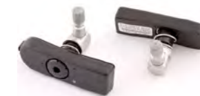
TPMS - SISTEMA DE MONITORAMENTO DA PRESSÃO DOS PNEUS JP/HONG KONG A9640056 ROW A9640169