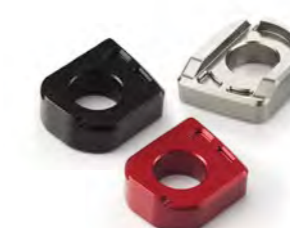
BLOCO REGULADOR DE CORRENTE USINADO COM NERVURAS GUNMETAL CINZA ANODIZADO A9640158 PRETO ANODIZADO A9640045 VERMELHO ANODIZADO A9640046