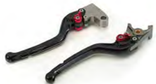
MANETES AJUSTÁVEIS A2021447