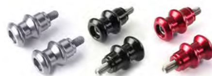
SUPORTE "PADDOCK" GUNMETAL CINZA ANODIZADO A9640159 PRETO ANODIZADO A9640082 VERMELHO ANODIZADO A9640083