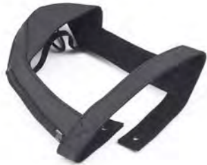
SUPORTE PARA MALA TRASEIRA A9510203