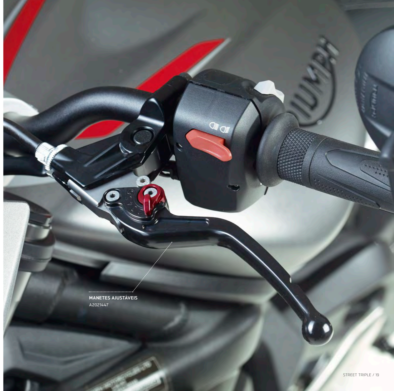
MANETES AJUSTÁVEIS A2021447