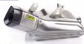
SILENCIADOR ARROW EU A9600562