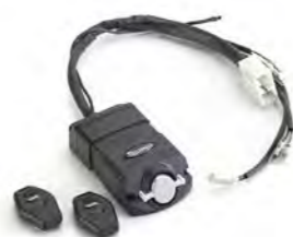
KIT DE ALARME - APROVADO PELA THATCHAM A9808123 NÃO HOMOLOGADO NO BRASIL