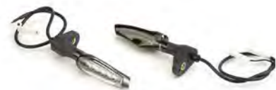
INDICADORES LED A2701151