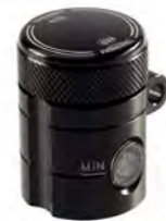
RESERVATÓRIO DO FREIO TRASEIRO CNC USINADO A9628055