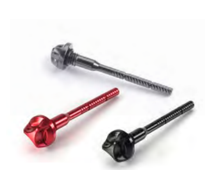
VARETA DO ÓLEO GUNMETAL CINZA ANODIZADO A9610215 PRETO ANODIZADO A9610128 VERMELHO ANODIZADO A9610129