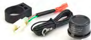
RELÉ DE INDICADOR LED A9830046