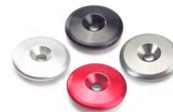
ACABAMENTO PARA EXTREMIDADE DO GUIDÃO TRANSPARENTE ANODIZADO A9630431 PRETO ANODIZADO A9630367 VERMELHO ANODIZADO A9630432 GUNMETAL CINZA ANODIZADO A9630434 CETIM ANODIZADO A9630436