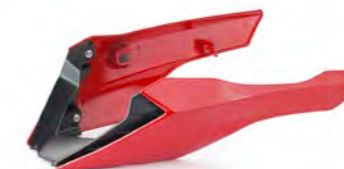
CARENAGEM INFERIOR A9708385-##