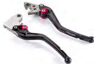
MANETES AJUSTÁVEIS A9620062