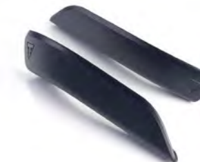
PROTEÇÃO PARA BRAÇO OSCILANTE A9640188