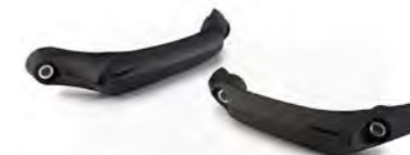
PROTEÇÃO DE ESTRUTURA A9788013