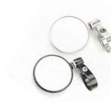
ESPELHO DE EXTREMIDADE REDONDO (70 MM) PRETO ANODIZADO A9638136 TRANSPARENTE ANODIZADO A9638137