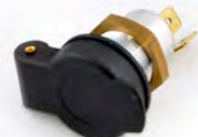
TOMADA AUXILIAR A9828027