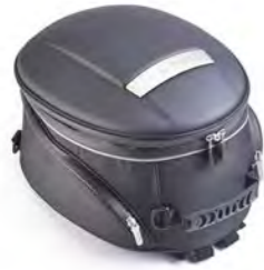
BOLSA DE TANQUE A9510248