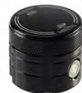
RESERVATÓRIO DO FREIO DIANTEIRO CNC USINADO A9628045