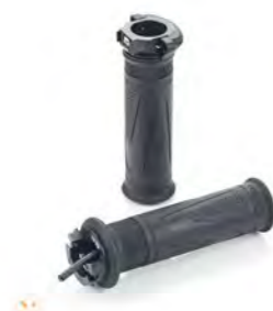
MANOPLAS AQUECIDAS A9638180