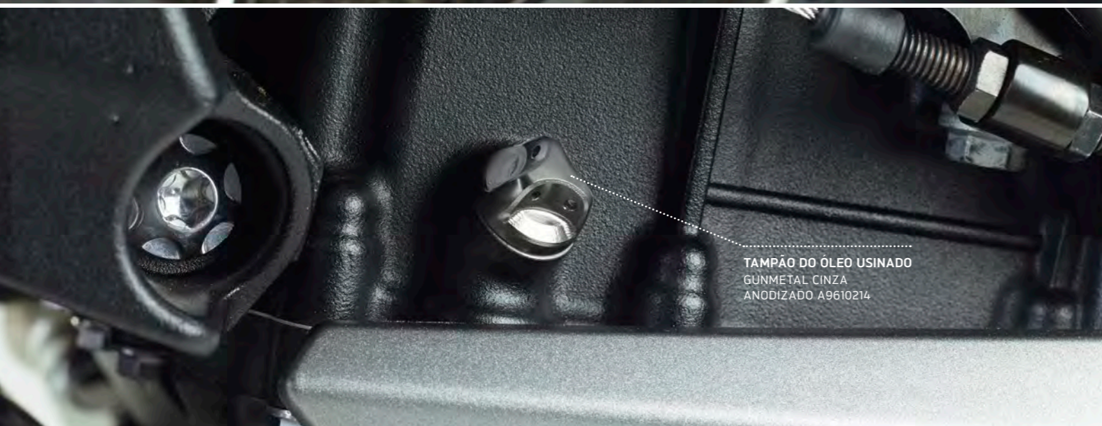
TAMPÃO DO ÓLEO USINADO GUNMETAL CINZA ANODIZADO A9610214