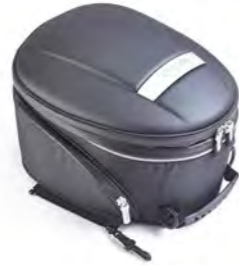
MALA TRASEIRA A9510249