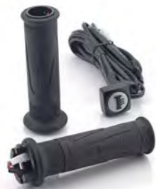
MANOPLAS AQUECIDAS A9638191