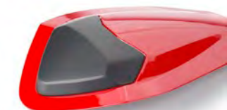
PROTEÇÃO DE ASSENTO A9708386-##