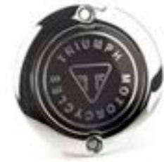
MOTORDECKEL CHROM A9610255