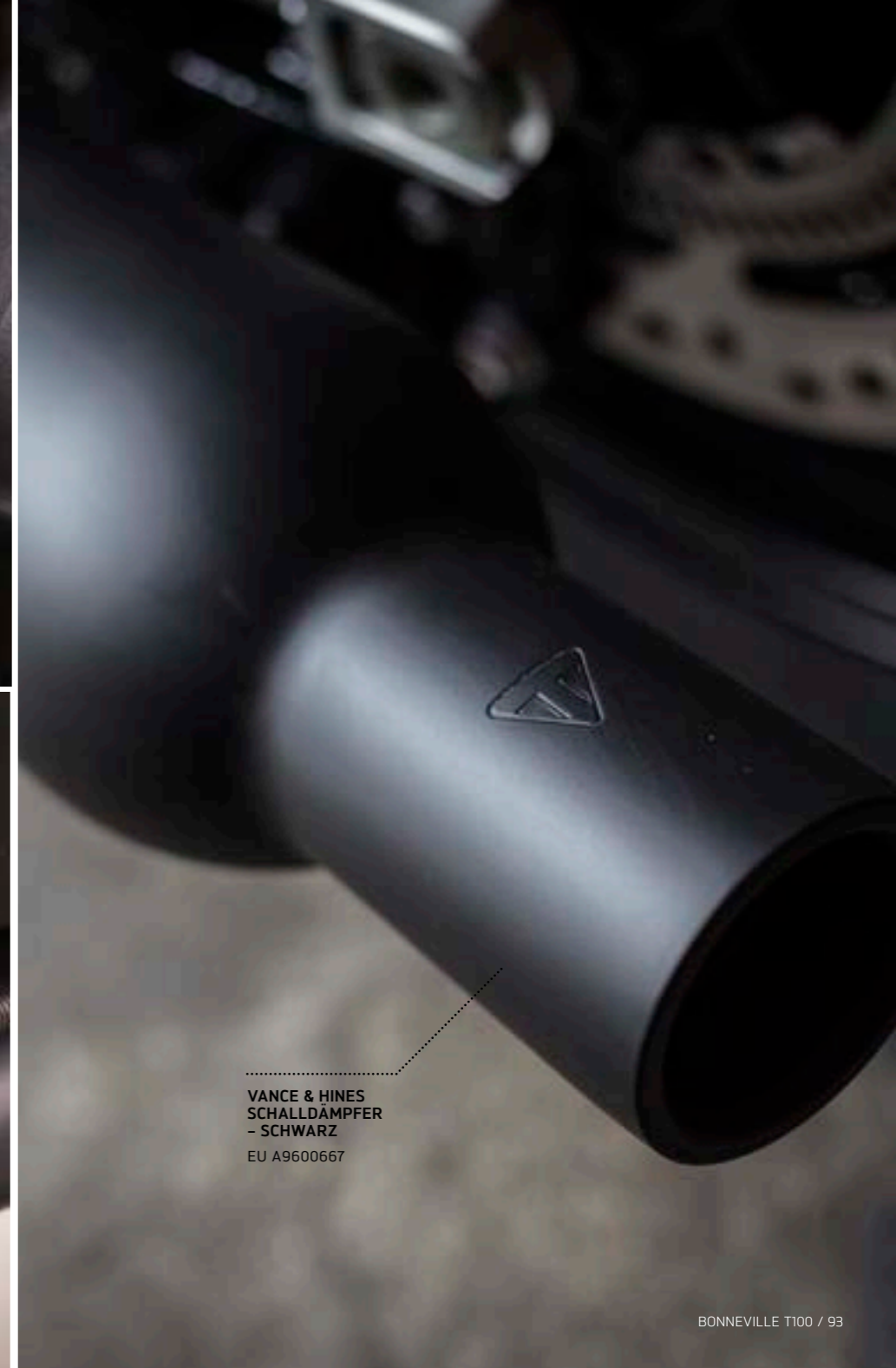
VANCE & HINES SCHALLDÄMPFER - SCHWARZ EU A9600667