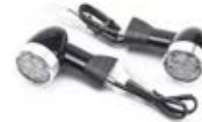
LED-BULLET-BLINKER 40 MM, KURZER SCHAFT - EU HINTEN A9838039