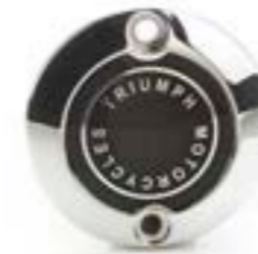
MOTORDECKEL-EMBLEM CHROM A9610263