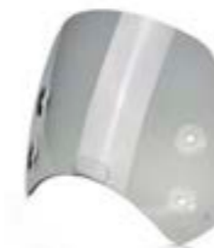
KURZE WINDSCHUTZSCHEIBE LIGHT TINTED A9708407