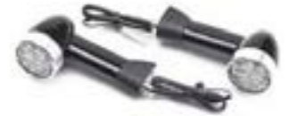
LED-BULLET-BLINKER 40 MM, MITTLERER SCHAFT - EU VORNE A9838041