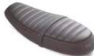
KOMFORTSITZ BROWN A2306448