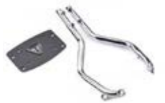
RÜCKENLEHNE MIT SOZIUSBÜGEL CHROM A9758183