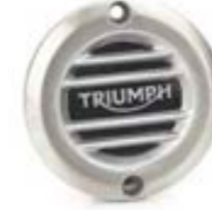
GERIFFELTES MOTORDECKEL-EMBLEM GEBÜRSTET A9610252