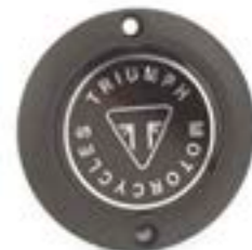
MOTORDECKEL BLACK A9610257