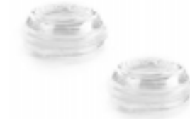
BLINKERSATZ MIT KLAREM GEHÄUSE A2709046