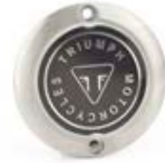
MOTORDECKEL GEBÜRSTET A9610256