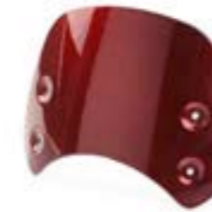
KURZE WINDSCHUTZSCHEIBE LACKIERT A9708381