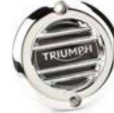
GERIFFELTES MOTORDECKEL-EMBLEM CHROM A9610251