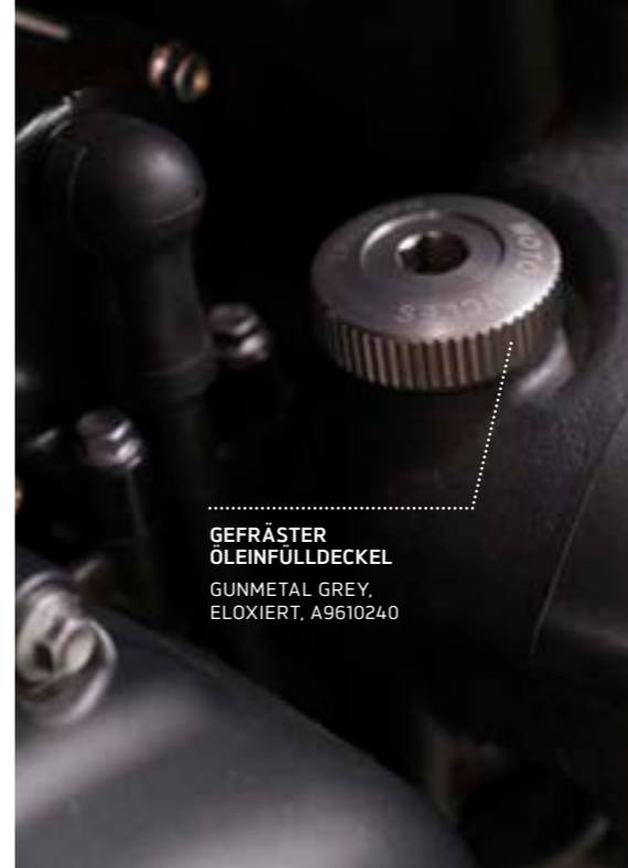
GEFRÄSTER ÖLEINFÜLLDECKEL GUNMETAL GREY, ELOXIERT, A9610240