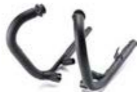
KRÜMMER KIT BLACK A9600651