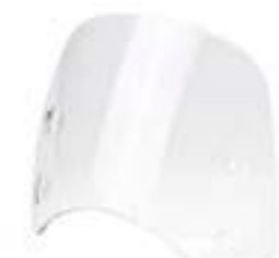
KURZE WINDSCHUTZSCHEIBE CLEAR A9708303