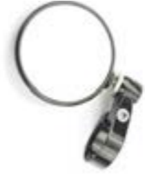
LENKERENDSPIEGEL RUND (70 MM) BLACK, ELOXIERT, A9638136