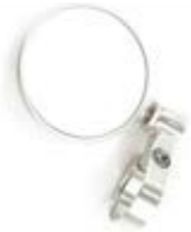
LENKERENDSPIEGEL RUND (70 MM) CLEAR, ELOXIERT, A9638137