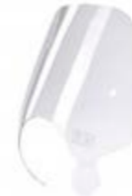
LANGSTRECKEN- WINDSCHUTZSCHEIBE A9708304