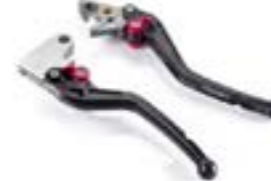
VERSTELLBARE HEBEL A9628054