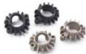
GERIFFELTE KRÜMMERFLANSCH BLACK A9600610 VAPOUR BLASTED A9600753