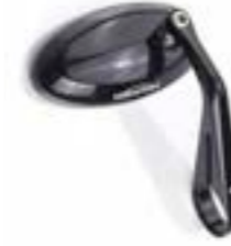
LENKERENDSPIEGEL BLACK, ELOXIERT, A9630205