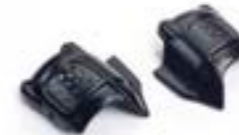
ANSAUGKANAL-ABDECKUNG BLACK A9618196