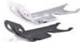
ÖLWANNENSCHUTZ CLEAR, ELOXIERT, A9708340 BLACK, ELOXIERT, A9708380