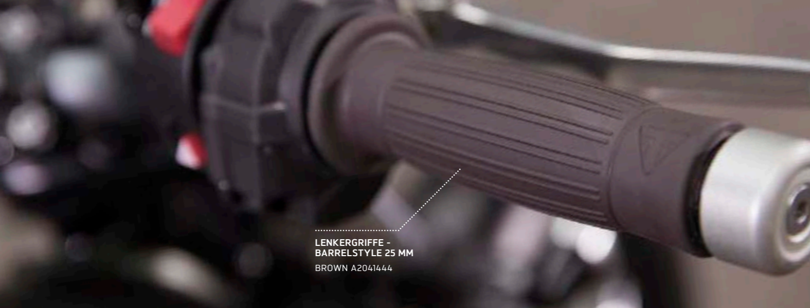
LENKERGRIFFE - BARRELSTYLE 25 MM BROWN A2041444