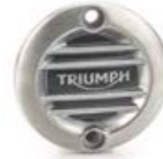
GERIFFELTES MOTORDECKEL-EMBLEM GEBÜRSTET A9610260