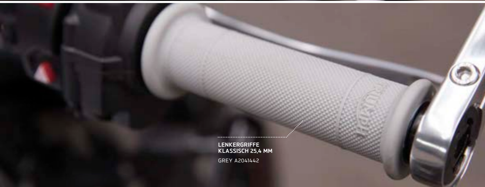
LENKERGRIFFE KLASSISCH 25,4 MM GREY A2041442