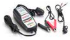
TRIUMPH BATTERIEOPTIMIERER UK A9930410 EU A9930411 US A9930412 JP A9930414