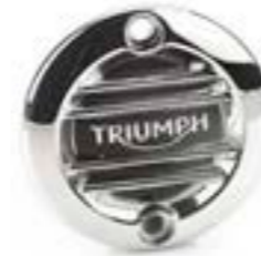
GERIFFELTES MOTORDECKEL-EMBLEM CHROM A9610259