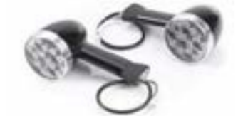
LED-BULLET-BLINKER 64 MM, LANGER SCHAFT - US VORNE A9838048