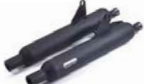
VANCE & HINES SCHALLDÄMPFER - SCHWARZ EU A9600667