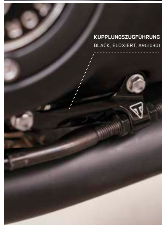
KUPPLUNGSZUGFÜHRUNG BLACK, ELOXIERT, A9610301