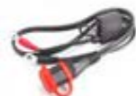
ANSCHLUSSLEITUNG- OPTIMIERUNG A9930415