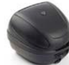
TOP BOX A9508192