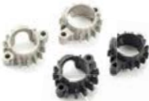
KLEINE KRÜMMERFLANSCH VAPOUR BLASTED A9600719 BLACK A9600718