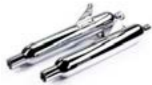
VANCE & HINES SCHALLDÄMPFER - CHROM A9600661