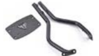
RÜCKENLEHNE MIT SOZIUSBÜGEL BLACK A9758302