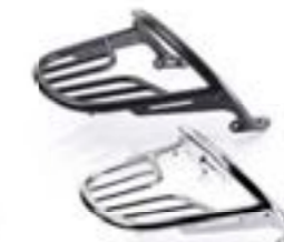
SITZBANKBÜGEL MIT GEPÄCKBRÜCKE CHROM A9758190 BLACK A9758301