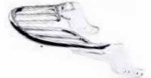
GEPÄCKBRÜCKE HINTEN CHROM A9758191