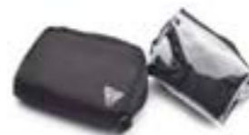
REGENABDECKUNG MIT BEUTEL FÜR TANKRUCKSACK A9510228