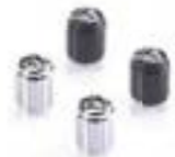
LASERGRAVIERTE VENTILKAPPEN CHROME A2009006 BLACK A2009036