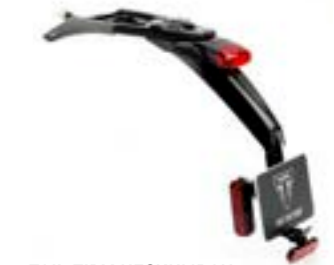
TAIL TIDY HECKUMBAU A9708436