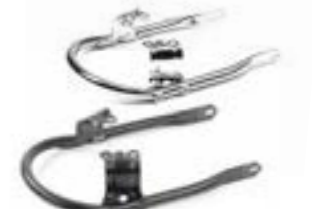
SITZBANKBÜGEL- MONTAGESATZ CHROM A9758182 BLACK A9758299