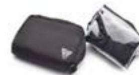
REGENABDECKUNG UND BEUTEL FÜR KOFFERTASCHE A9950009