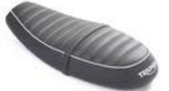
ASIENTO BIPLAZA DE PERFIL BAJO A2302628