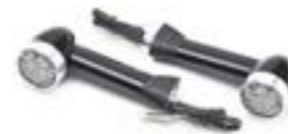
INDICADOR DE BALA LED DE 40 MM DE TALLO LARGO - UE PARTE DELANTERA A9838035