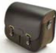
ALFORJA DE ALGODÓN ENCERADO - VERDE OLIVA LADO DERECHO A9518153 LADO IZQUIERDO A9518176