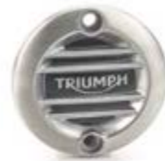
INSIGNIA ACG ESTRIADA CEPILLADO A9610260