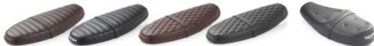
ASIENTO ACANALADO NEGRO A2304343 MARRÓN A2304634