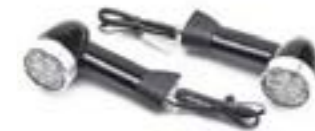
INDICADOR DE BALA LED DE 40 MM DE TALLO MEDIO - UE PARTE DELANTERA A9838041