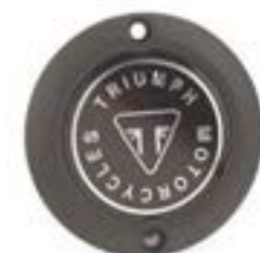
INSIGNIA DEL EMBRAGUE NEGRO A9610257