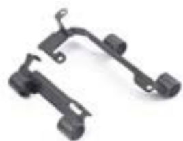
KIT DE MONTAJE DE BLOQUEO EN U