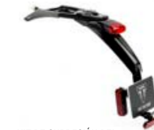
KIT DE SUPRESIÓN DEL GUARDABARROS A9708436