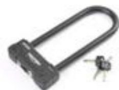
CANDADO EN U DE 270 MM