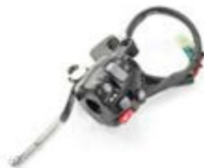
CONTROL DE CRUCERO