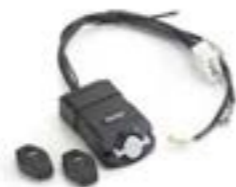
KIT DE ALARMA - APROBADO POR THATCHAM