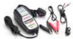
OPTIMIZADOR DE BATERÍA TRIUMPH

UK A9930410 EU A9930411 US A9930412 JP A9930414