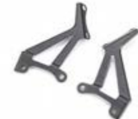
KIT DE MONTAJE DE PANTALLA/CÚPULA A9708302