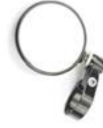
ESPEJO RETROVISOR REDONDO DE EXTREMO DE MANILLAR (70 MM) NEGRO ANODIZADO A9638136