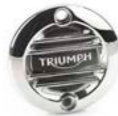
INSIGNIA ACG ESTRIADA CROMADO A9610259