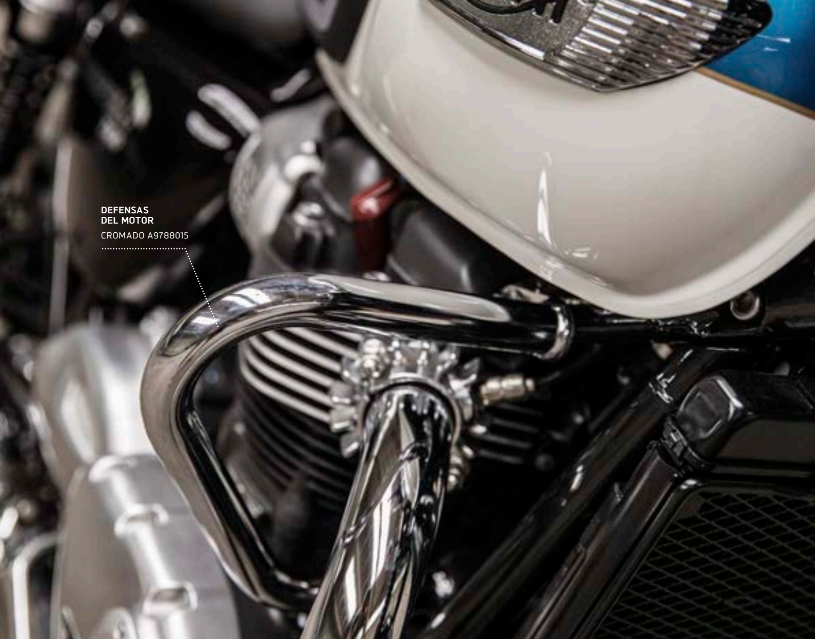
DEFENSAS DEL MOTOR CROMADO A9788015