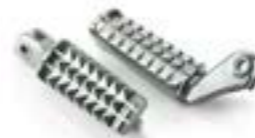
ESTRIBERAS PARA EL ACOMPAÑANTE A9770148