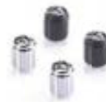
TAPONES DE VÁLVULA GRABADOS POR LÁSER CROMADO A2009006 NEGRO A2009036