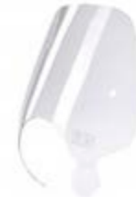
PANTALLA TOURING A9708304