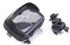
SOPORTE PARA EL TELÉFONO DE 140 X 90 MM