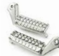
REPOSAPIÉS DE CONDUCTOR A9770145