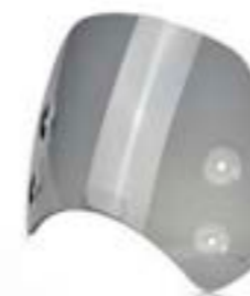
CÚPULA BAJA TINTADO OSCURO A9708151