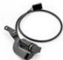
TOMA ELÉCTRICA AUXILIAR DE CABINA