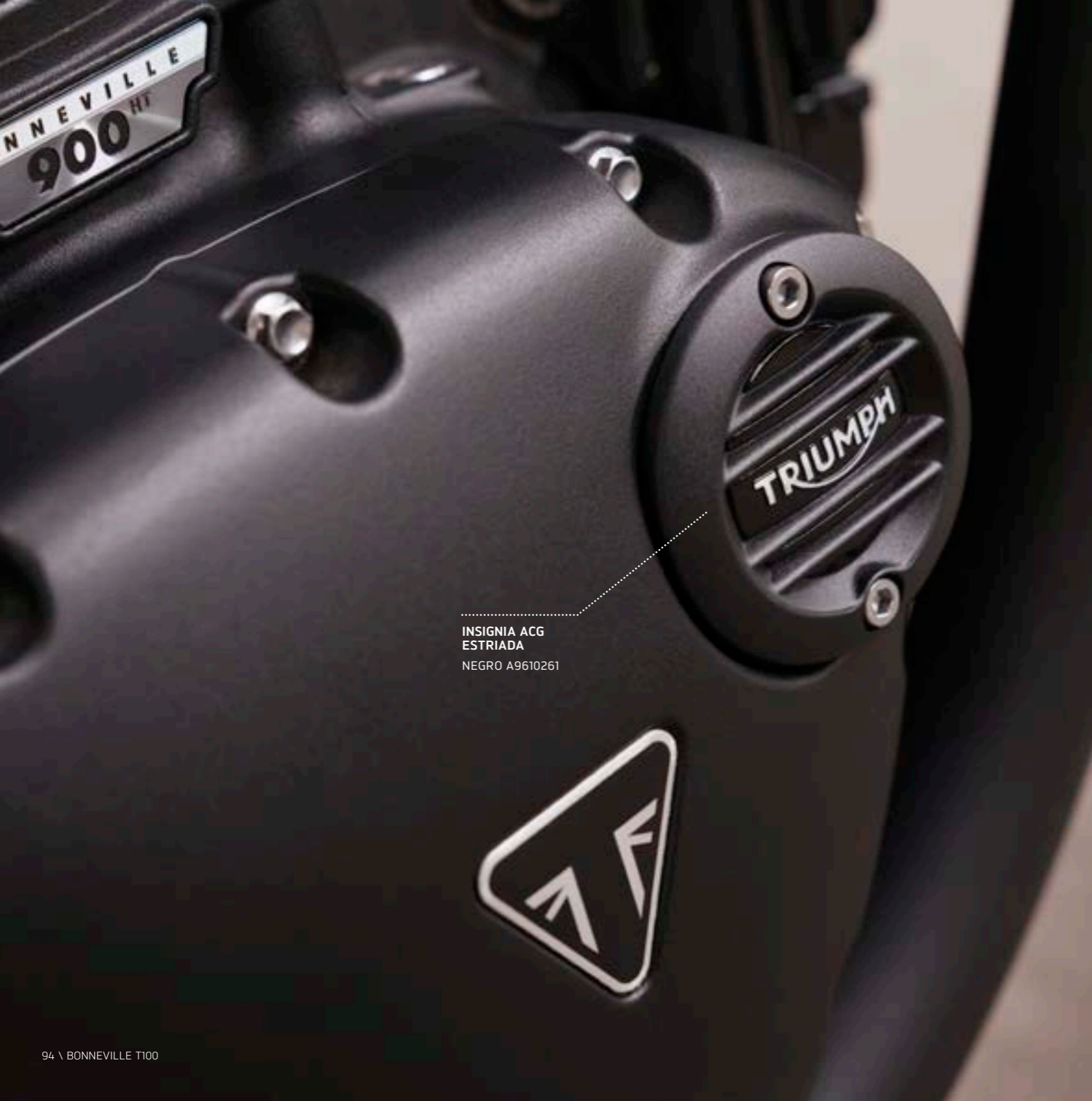
INSIGNIA ACG ESTRIADA NEGRO A9610261