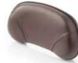
ALMOHADILLA DEL RESPALDO DE LUJO MARRÓN A9750768 MARRÓN A9750773