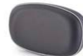
ALMOHADILLA DE RESPALDO NEGRO A2308914