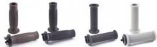
PUÑOS BARREL STYLE DE 25 MM NEGRO A2041443 MARRÓN A2041444