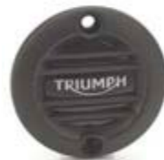
INSIGNIA ACG ESTRIADA NEGRO A9610261