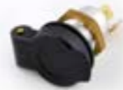
TOMA ELÉCTRICA AUXILIAR