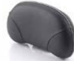
ALMOHADILLA DEL RESPALDO DE LUJO NEGRO A9750732