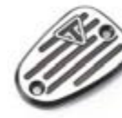
TAPÓN DEL DEPÓSITO MECANIZADO POR CNC A2026055