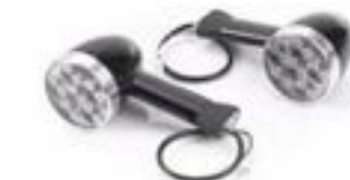
INDICADOR DE BALA LED DE 64 MM DE TALLO LARGO - EE. UU. PARTE DELANTERA A9838048