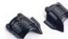
TAPAS DE ADMISIÓN NEGRO A9618196