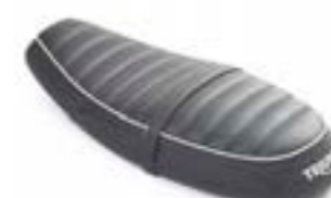
ASIENTO COMFORT NEGRO A2306447