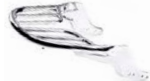
SOPORTE TRASERO CROMADO A9758191