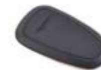
PROTECTOR DE GOMA DEL DEPÓSITO A9798027