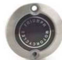
INSIGNIA ACG CEPILLADO A9610264