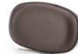
ALMOHADILLA DE RESPALDO MARRÓN A2308919 MARRÓN A2308981