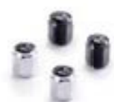
TAPONES DE VÁLVULA INSIGNIA EN BURBUJA CROMADO A2009007 NEGRO A2009037