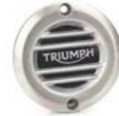
INSIGNIA DEL EMBRAGUE ESTRIADA CEPILLADO A9610252