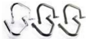
DEFENSAS DEL MOTOR CROMADO A9788015 BLACK A9788022 GRAPHITE A9788023