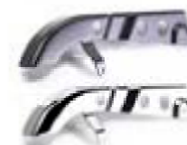
PROTECTOR DE CADENA CROMADO A2055009 BLACK A2055008