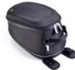
BOLSA DE DEPÓSITO DE NYLON A9518091