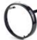
ARO DE FARO A9838240