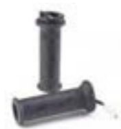
PUÑOS CALEFACTABLES A9638105