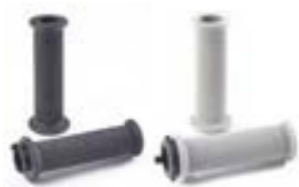
PUÑOS - DISEÑO DE ROMBOS DE 25,4 MM NEGRO A2041441 GRIS A2041442