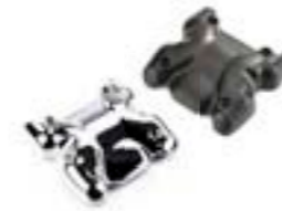
KIT DE TAPA DEL ÁRBOL DE LEVAS CROMADO A9618150 NEGRO A9618197