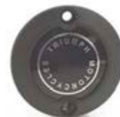
INSIGNIA ACG NEGRO A9610265