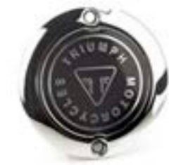
INSIGNIA DEL EMBRAGUE CROMADO A9610255