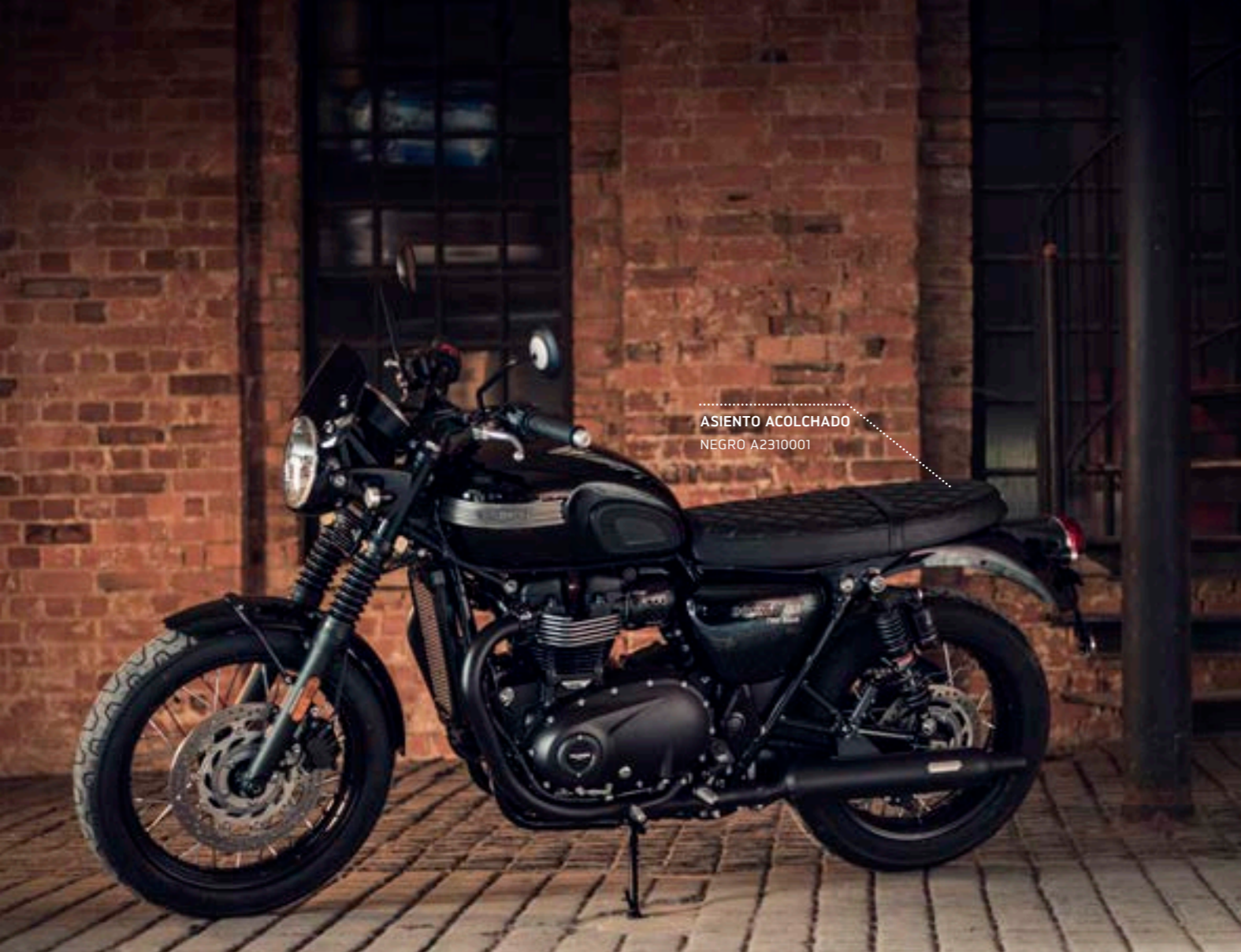
ASIENTO ACOLCHADO NEGRO A2310001