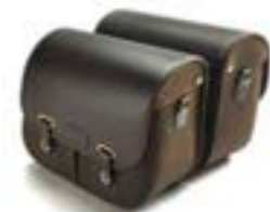
ALFORJAS DE ALGODÓN ENCERADO VERDE OLIVA A9518082