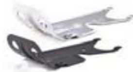
CUBRE CÁRTER ANODIZADO CLARO A9708340 NEGRO ANODIZADO A9708380