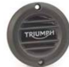
INSIGNIA DEL EMBRAGUE ESTRIADA NEGRO A9610253