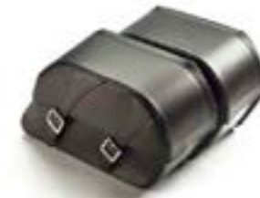
MALETAS DE CUERO A9518178