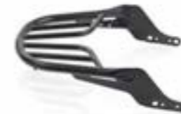
SOPORTE TRASERO NEGRO A9758303