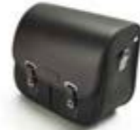
ALFORJA DE ALGODÓN ENCERADO - NEGRO LADO DERECHO A9518156 LADO IZQUIERDO A9518177