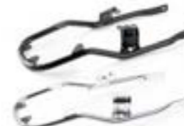
KIT DE MONTAJE DE SOPORTE NEGRO A9758308 CROMADO A9758309