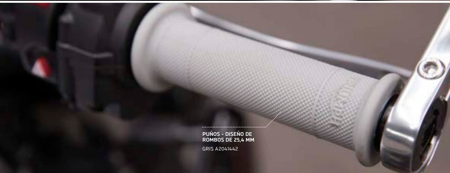
PUÑOS - DISEÑO DE ROMBOS DE 25,4 MM GRIS A2041442