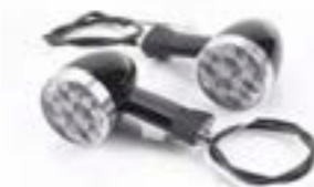
INDICADOR DE BALA LED DE 64 MM DE TALLO MEDIO - EE. UU. PARTE TRASERA A9838038