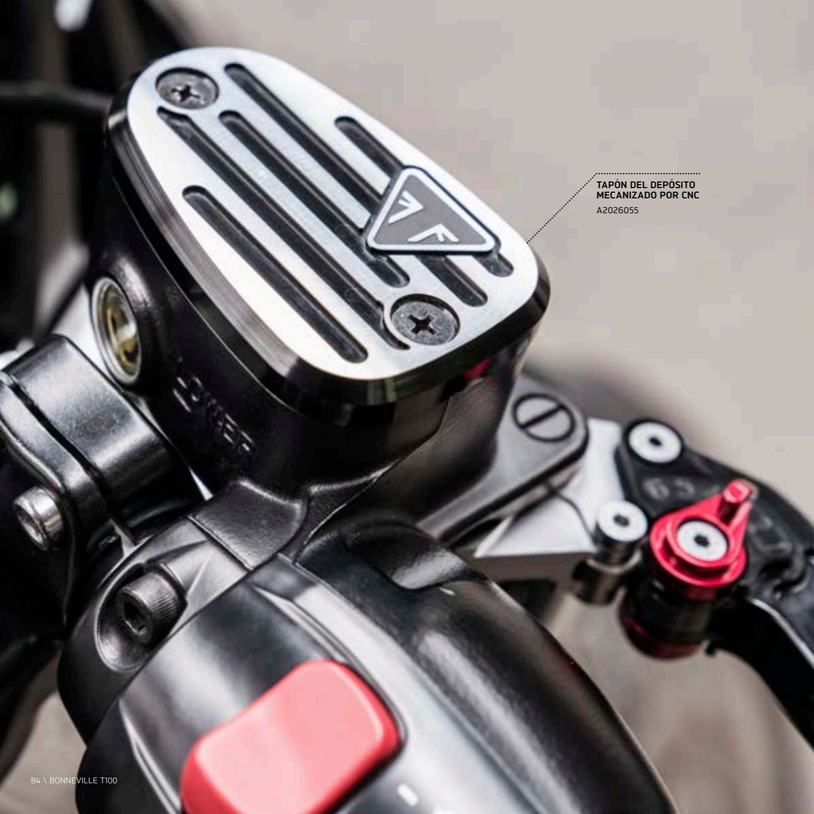
TAPÓN DEL DEPÓSITO MECANIZADO POR CNC A2026055