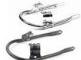
KIT DE MONTAJE DE RIELES DE SUJECIÓN CROMADO A9758182 NEGRO A9758299