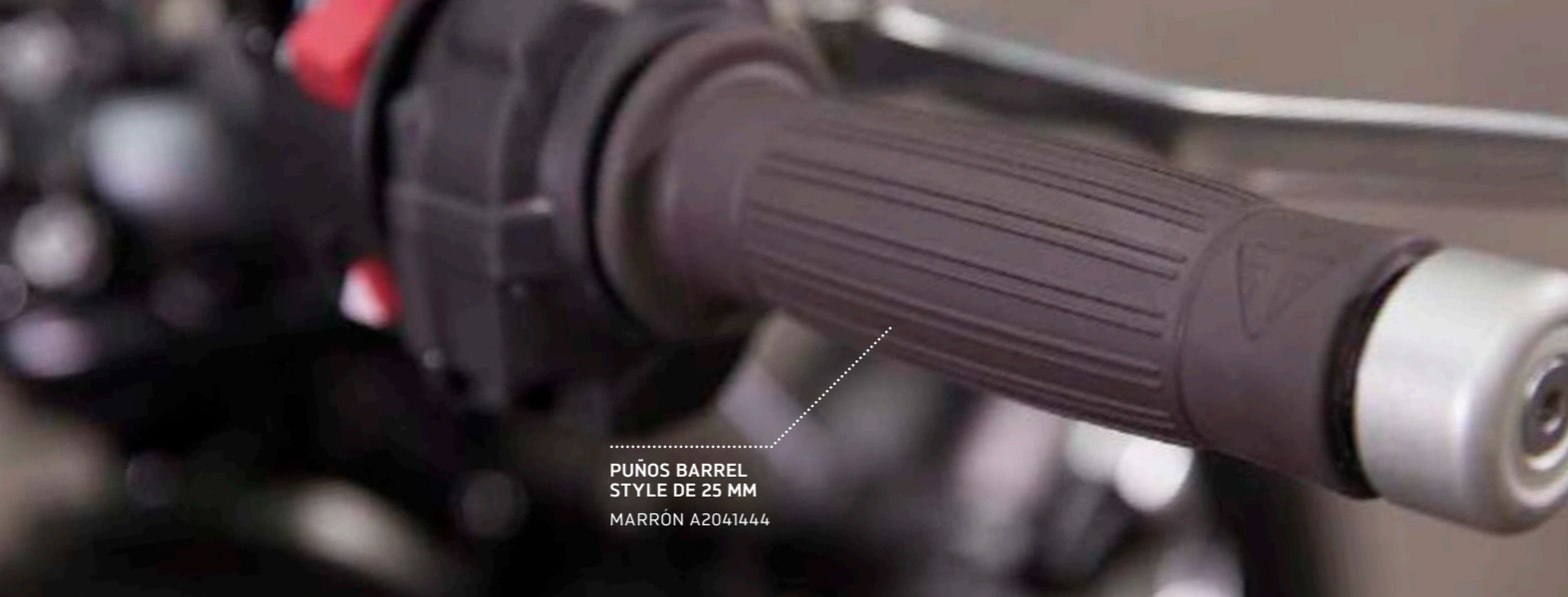
PUÑOS BARREL STYLE DE 25 MM MARRÓN A2041444