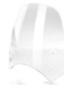
PANTALLA ALTA CLARO A9708408