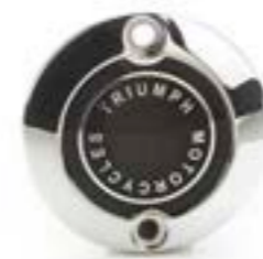
INSIGNIA ACG CROMADO A9610263