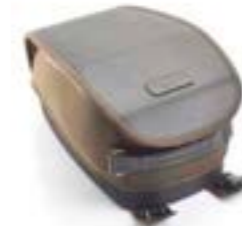
BOLSA DE DEPÓSITO DE ALGODÓN ENCERADO VERDE OLIVA A9518089