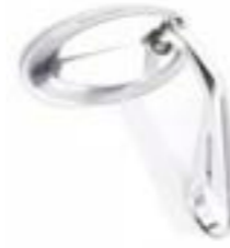
RETROVISOR DE EXTREMO DE MANILLAR ANODIZADO CLARO A9630206