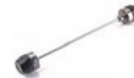
PROTECTORES DE HORQUILLA A9640099