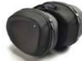
MALETAS DE NYLON A9518148