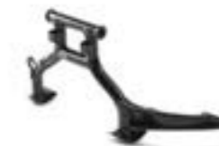
CABALLETE CENTRAL A9778020