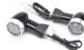
INDICADOR DE BALA LED DE 40 MM DE TALLO CORTO - UE PARTE TRASERA A9838039