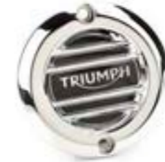
INSIGNIA DEL EMBRAGUE ESTRIADA CROMADO A9610251