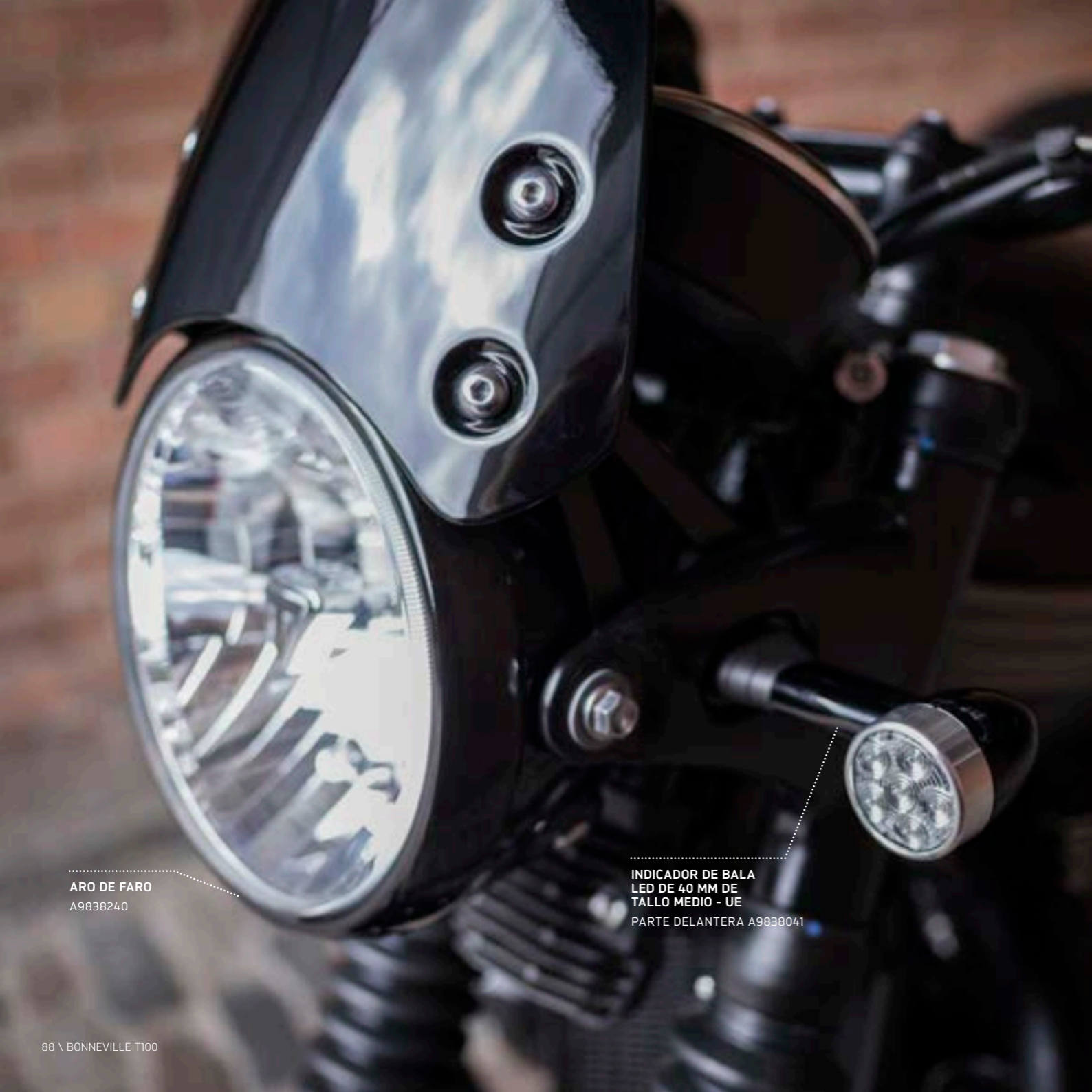
ARO DE FARO A9838240