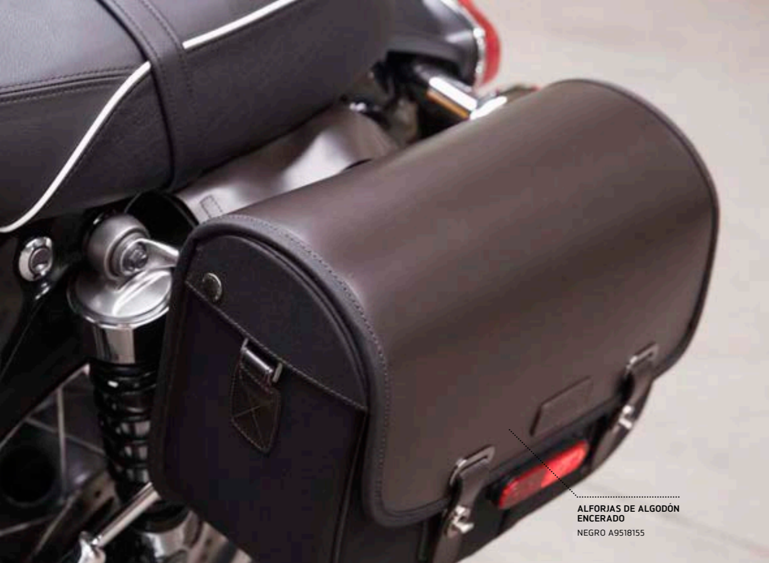
ALFORJAS DE ALGODÓN ENCERADO NEGRO A9518155