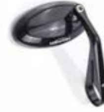
RETROVISOR DE EXTREMO DE MANILLAR NEGRO ANODIZADO A9630205