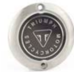
INSIGNIA DEL EMBRAGUE CEPILLADO A9610256