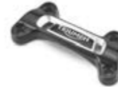
ABRAZADERA PARA MANILLAR SUPERIOR DE 25,4 MM A2041631