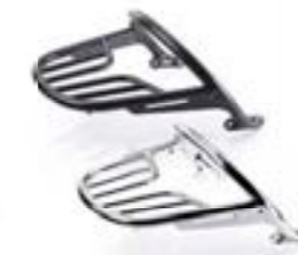
RIEL Y SOPORTE DE SUJECIÓN CROMADO A9758190 NEGRO A9758301