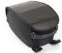
BOLSA DE DEPÓSITO DE ALGODÓN ENCERADO NEGRO A9518100