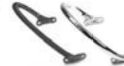
BARRA DE AGARRE CROMADO A9758181 NEGRO A9758300