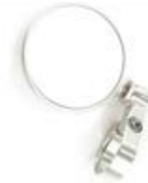
ESPEJO RETROVISOR REDONDO DE EXTREMO DE MANILLAR (70 MM) ANODIZADO CLARO A9638137