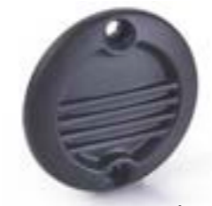
TAPA DE INSPECCIÓN A9618194