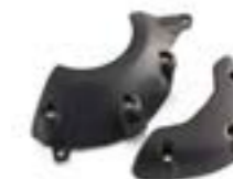
PROTECTOR DE MOTOR A9618149