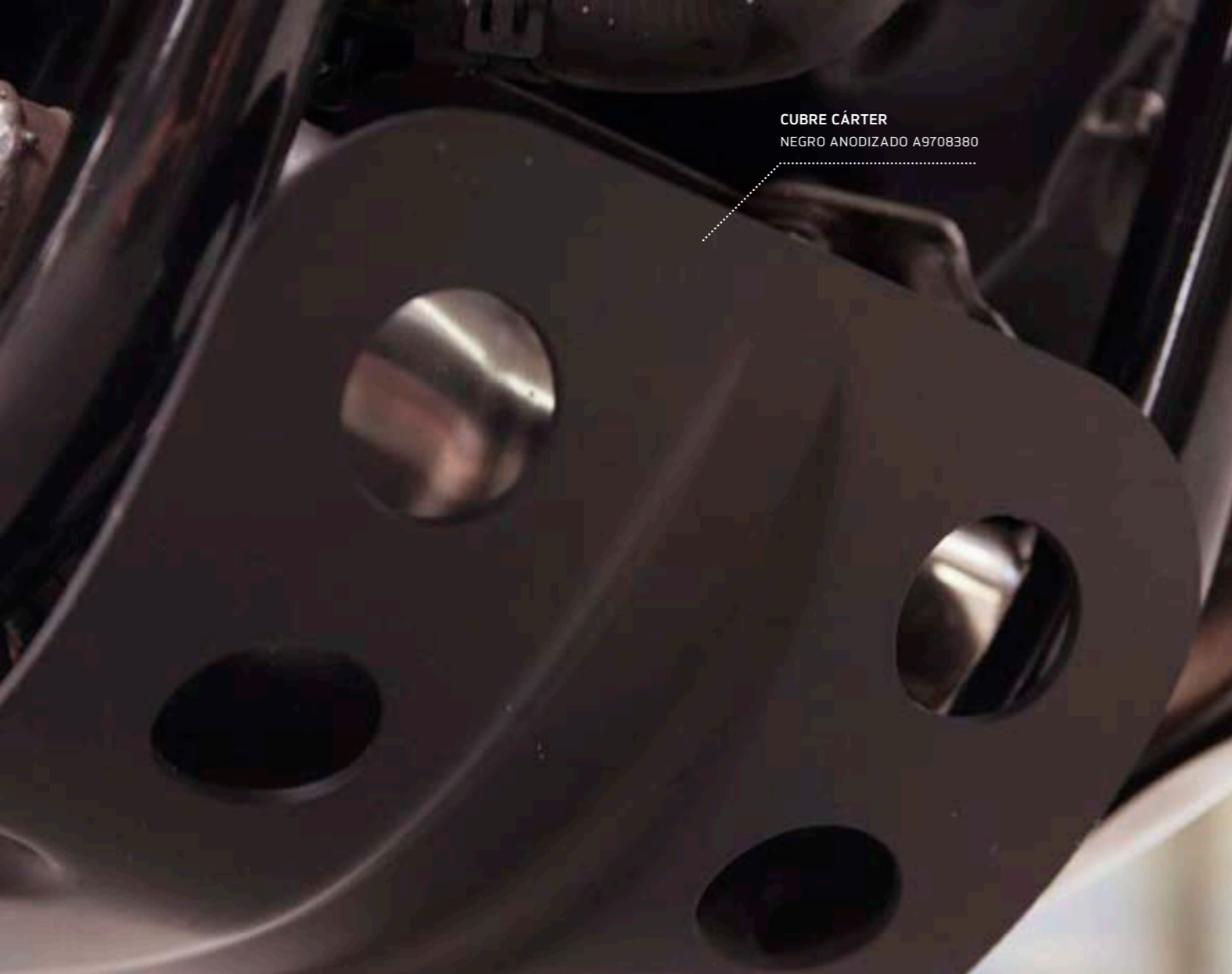
CUBRE CÁRTER NEGRO ANODIZADO A9708380