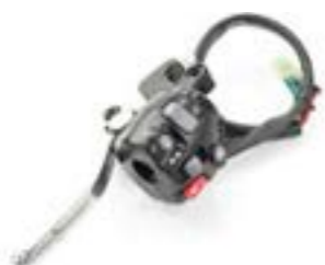
CONTROL DE CRUCERO NO DRL