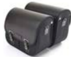
ALFORJAS DE ALGODÓN ENCERADO NEGRO A9518155