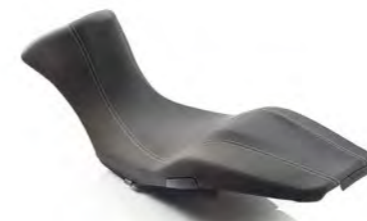
ASIENTO COMFORT BAJO A2305573