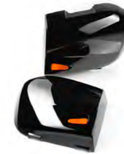
TAPA PARA 2 MALETAS A9508191-##