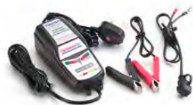
OPTIMIZADOR DE BATERÍA TRIUMPH UK A9930410 EU A9930411 US A9930412 AUS A9930413 JP A9930414