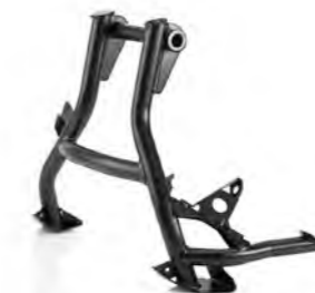
CABALLETE CENTRAL A9778016