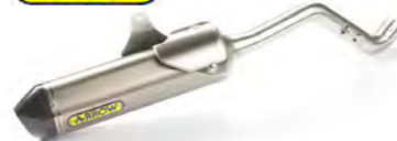
SILENCIADOR ARROW A9600612