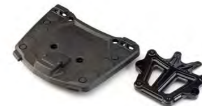
PARRILLA DE FIJACIÓN DE BAUL A9508076