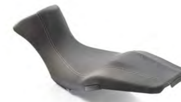
ASIENTO COMFORT A2305574