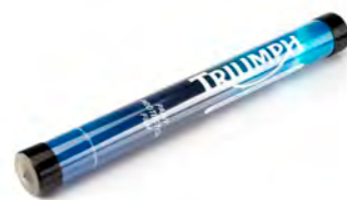
KIT DE PROTECCIÓN DE PINTURA MALETA A9938189