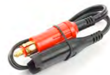
CABLE DEL ADAPTADOR OPTIMATE A9930416