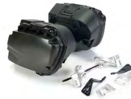
JUEGO DE 2 MALETAS A9508092 A9508095