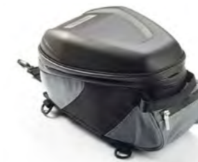
BOLSA DE DEPÓSITO A9510268