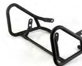
DEFENSA DEL MOTOR A9758164