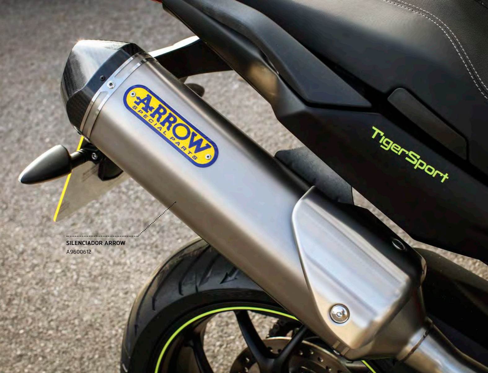
SILENCIADOR ARROW A9600612