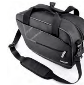
BOLSA INTERIOR PARA MALETAS A9508077