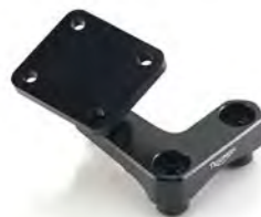
SOPORTE PARA GPS A9828038