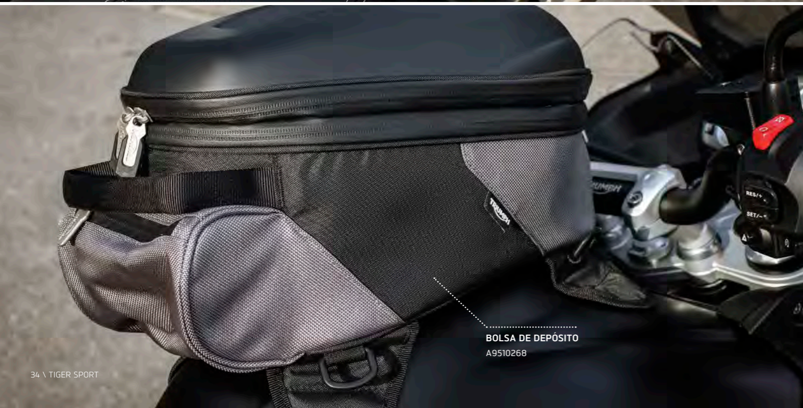
BOLSA DE DEPÓSITO A9510268