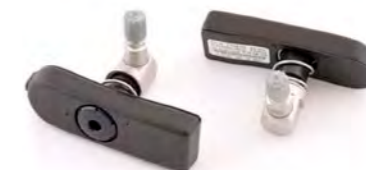
SISTEMA DE MONITORIZACIÓN DE PRESIÓN DE NEUMÁTICOS JP/HONG KONG A9640056 ROW A9640169