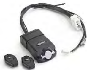
KIT DE ALARMA – APROBADO POR THATCHAM A9808118