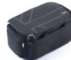
BOLSA INTERIOR PARA TOP BOX A9500505