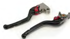
MANETAS AJUSTABLES A9620045