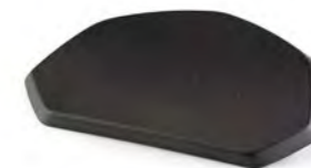
ALMOHADILLA DE RESPALDO A9500506