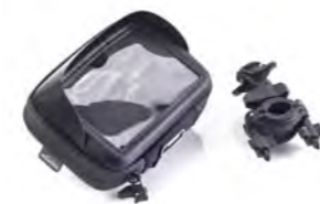
SOPORTE PARA EL TELÉFONO DE 140 X 90 MM A9510289 140X90MM A9510290 160X100MM A9510291 70X130MM