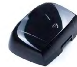
TAPA DEL BAÚL A9508156-##