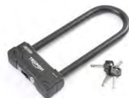
CANDADO EN U DE 270 MM A9810023