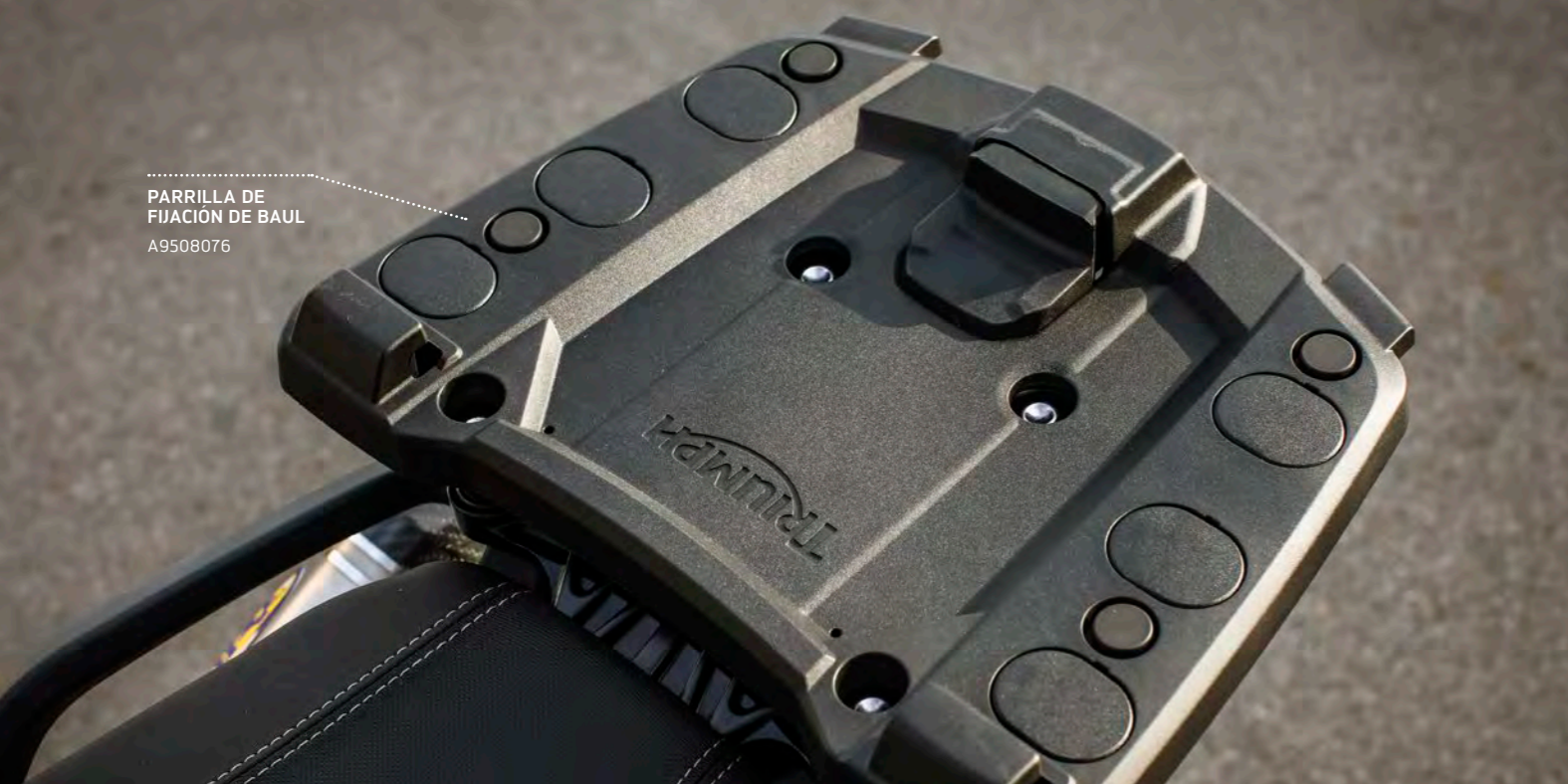
PARRILLA DE FIJACIÓN DE BAUL A9508076