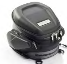
BOLSA A MEDIDA PARA EL COLÍN A9510269