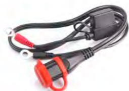
CABLE DE CONEXIÓN OPTIMATE A9930415