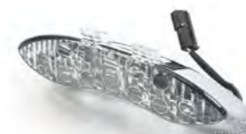
LUZ TRASERA CLARA A9700122