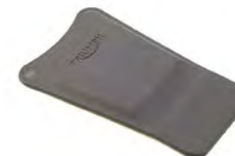
PROTECTOR DE GOMA DEL DEPÓSITO A9798023