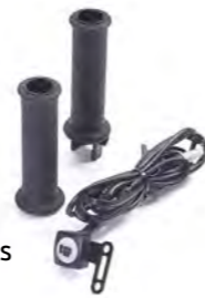
PUÑOS CALEFACTABLES A9638171