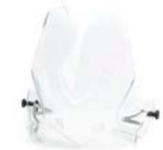
BULLE HAUTE AJUSTABLE A9708389