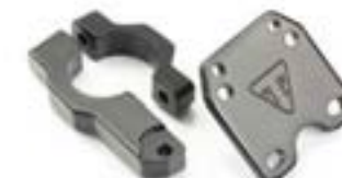
KIT DE MONTAGE GPS A9828035