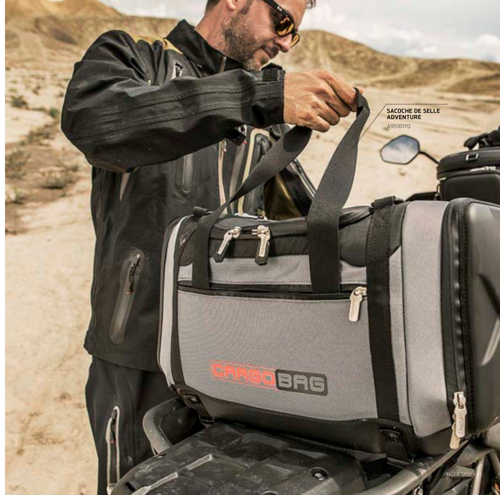
SACOCHÉ DE SELLE ADVENTURE A9510170