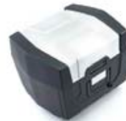
TOP-CASE ADVENTURE T2356830 A9500748