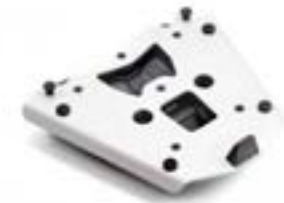
PLATINE DE TOP-CASE EXPEDITION A2353440