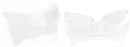
PROTECTION DE PHARE A9830108 A9838007