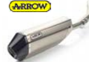
SILENCIEUX SLIP-ON ARROW A9600831