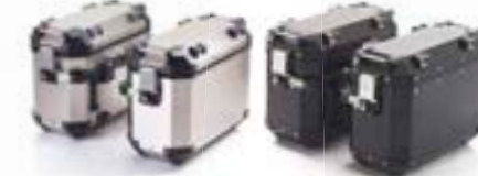
VALISES EXPEDITION ARGENT - A9500800 NOIR - A9500805