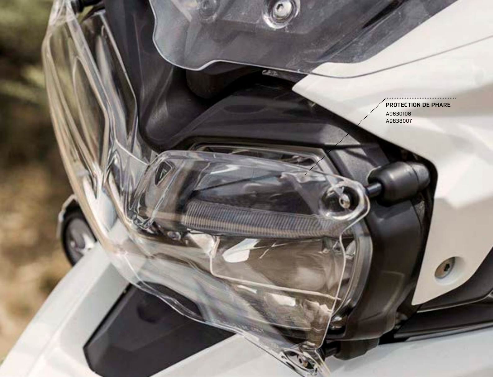
PROTECTION DE PHARE A9830108 A9838007