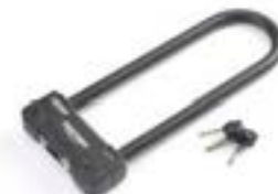
ANTIVOL EN U DE 320 MM A9810024