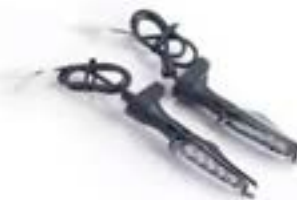
CLIGNOTANTS À LED A2701151