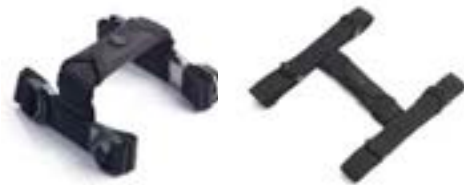
POIGNÉES DE TRANSPORT POUR VALISE EXPEDITION A9500665 A9500666