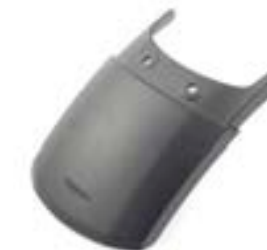
EXTENSION DE GARDE- BOUE AVANT A9708362