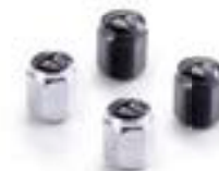
CAPUCHONS DE VALVE - BULLE À LOGO CHROME - A2009007 NOIR - A2009037