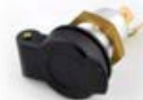
PRISE D'ALIMENTATION AUXILIAIRE A9828005