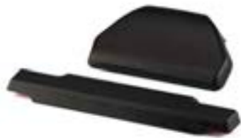
DOSSERETS DE TOP-CASE A9500514