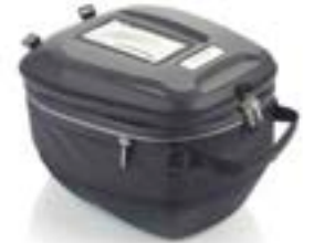
SACOCHE DE RÉSERVOIR À DÉMONTAGE RAPIDE A9510413