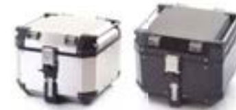
TOP-CASE EXPEDITION ARGENT - A9500810 NOIR - A9500815