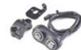
KIT DE MONTAGE DE CONTACTEUR A9638173