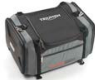
SACOCHÉ DE SELLE ADVENTURE A9510170