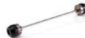
PROTECTIONS DE FOURCHE A9640179