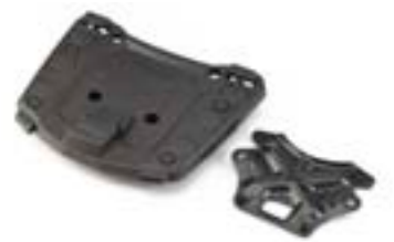
PLATINE DE TOP-CASE ADVENTURE A9508171