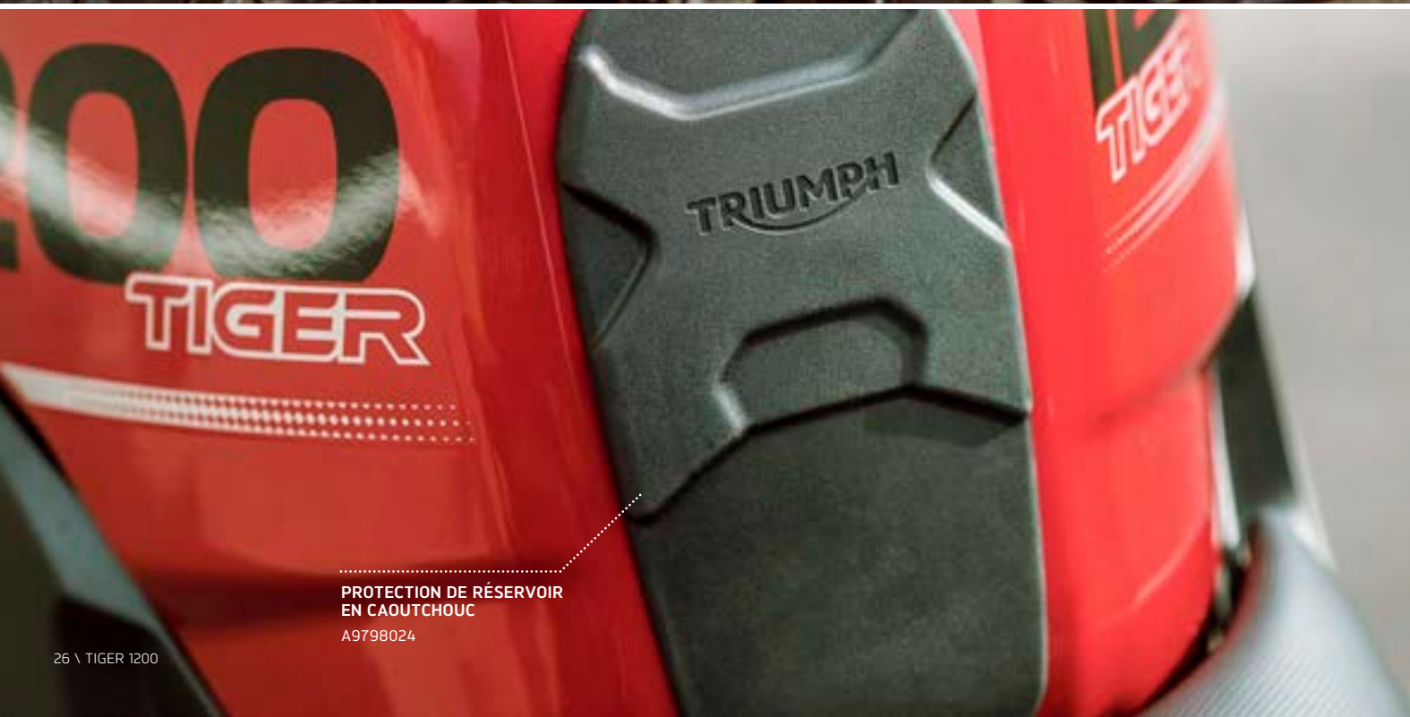
PROTECTION DE RÉSERVOIR EN CAOUTCHOUC A9798024