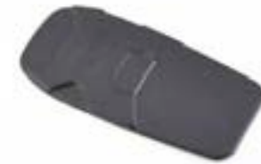
PROTECTION DE RÉSERVOIR EN CAOUTCHOUC A9798024