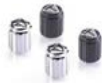
CAPUCHONS DE VALVE - GRAVURE AU LASER CHROME - A2009006 NOIR - A2009036