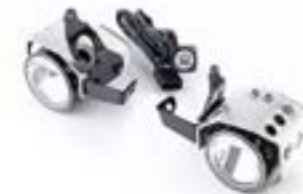
PHARES ANTIBROUILLARD À LED A9838250