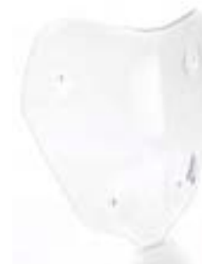
PARE-BRISE D'ÉTÉ A9708435