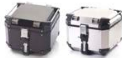
TOP-CASE EXPEDITION ARGENT - A9500530 NOIR - A9500606