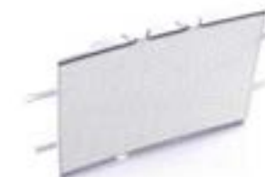
GRILLE DE RADIATEUR ALUMINIUM A9708282