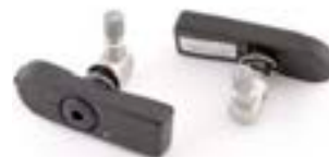
SYSTÈME DE CONTRÔLE DE LA PRESSION DES PNEUS TPMS JAPON/HONG KONG - A9640056 RESTE DU MONDE - A9640169 RESTE DU MONDE - A9640170 RESTE DU MONDE - A9640171