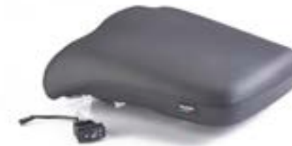
SELE PASSAGER CHAUFFANTE A9708367