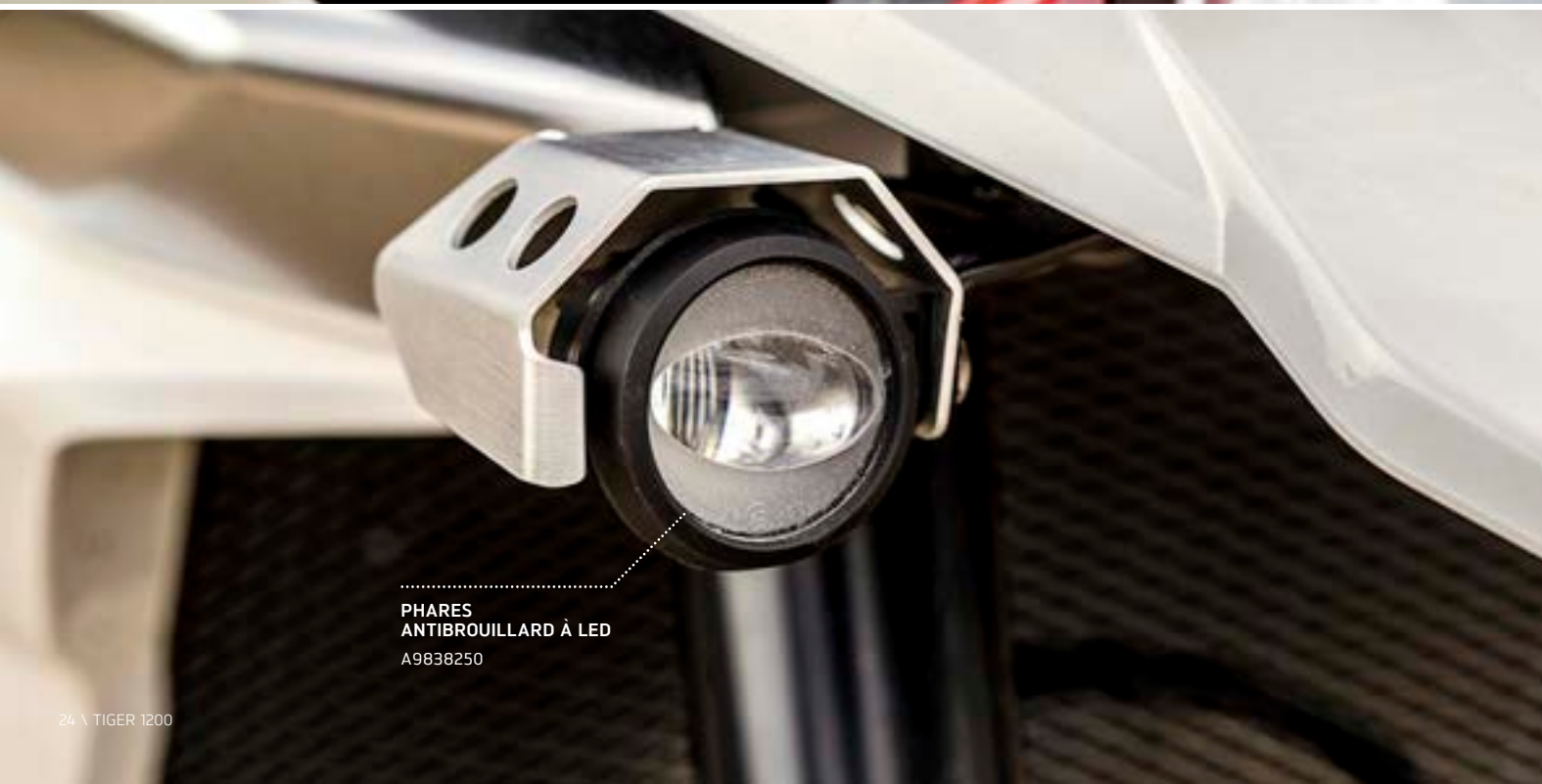
PHARES ANTIBROUILLARD À LED A9838250