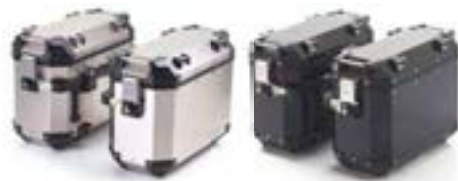
VALISES EXPEDITION ARGENT - A9500600 NOIR - A9500601

La gamme de bagagerie Expédition présente une structure en aluminium d'1,5 mm d'épaisseur ainsi que des renforts polymère sur les angles pour une protection optimale et un équilibre parfait entre résistance et légèreté. Grâce à un mécanisme de verrouillage à clé unique, seule la clé de contact de la moto est requise. Pour un confort optimal, la bagagerie Expédition offre une capacité combinée de 116 litres (Sacoche et top case compris).