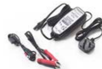
OPTIMISEUR DE BATTERIE TRIUMPH ROYAUME-UNI - A9930410 UE - A9930411 USA - A9930412 AUSTRALIE - A9930413 JAPON - A9930414