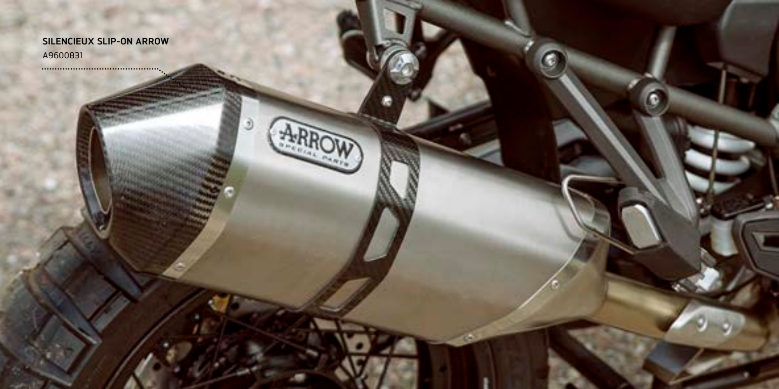
SILENCIEUX SLIP-ON ARROW A9600831