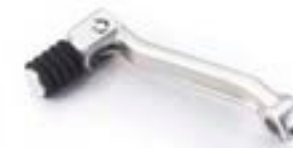
PÉDALE DE CHANGEMENT DE VITESSE PLIABLE A9778027