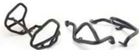
BARRES DE PROTECTION MOTEUR A9788062 A9788017