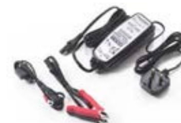
TRIUMPH BATTERIEOPTIMIERER UK A9930410 EU A9930411 US A9930412 AUS A9930413 JP A9930414