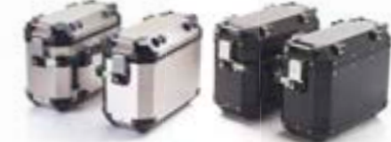
EXPEDITION KOFFER FÜR SCHLÜSSELLOSES BIKE SILVER A9500800 BLACK A9500805