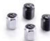
VENTILKAPPEN-RUNDEMBLEM CHROME A2009007 BLACK A2009037