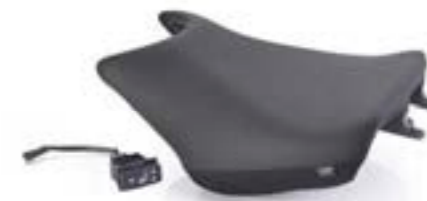
BEHEIZTER FAHRERSITZ A9700610 A9708366