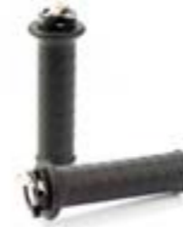
HEIZGRIFFE MIT ZWEISTUFIGER TEMPERATURREGELUNG A9638124