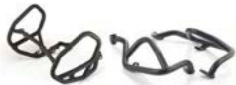
MOTOR-ZIERBÜGEL A9788062 A9788017