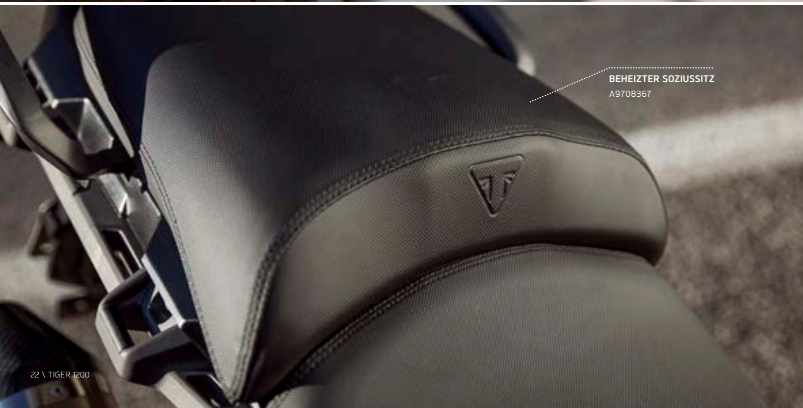
BEHEIZTER SOZIUSSITZ A9708367