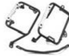
EXPEDITION KOFFER-MONTAGESATZ A9508193