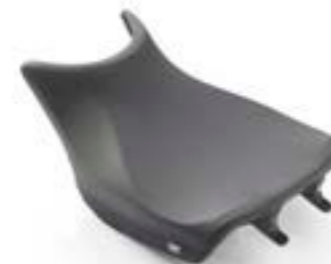
NIEDRIGER FAHRERSITZ (-20MM) A2305568