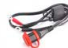
ANSCHLUSSLEITUNG-OPTIMATE A9930415 A9930416