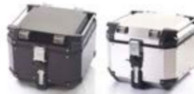
EXPEDITION TOP BOX SILVER A9500530 BLACK A9500606