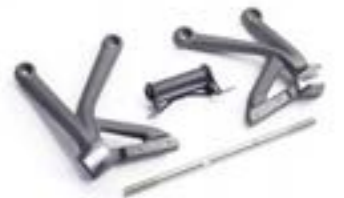
ADVENTURE KOFFER-MONTAGESATZ A9508194