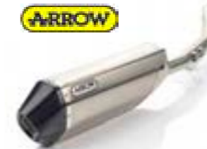
ARROW SLIP-ON- SCHALLDÄMPFER EU A9600831