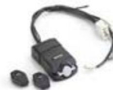
ALARMSATZ - THATCHAM- GENEHMIGT A9808122