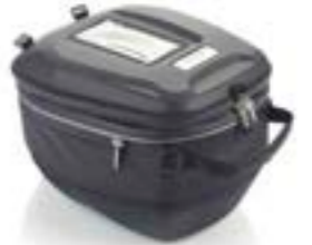
TANKRUCKSACK MIT SCHNELLVERSCHLUSS A9510413