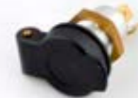
ZUSÄTZLICHE STROMVERSÖRGUNG A9828005