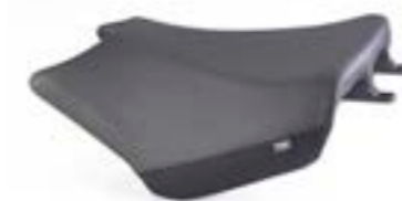
HOHER KOMFORT-FAHRERSITZ A2305549