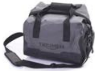
INNENTASCHE EXPEDITION TOP BOX, WASSERDICHT A9500521