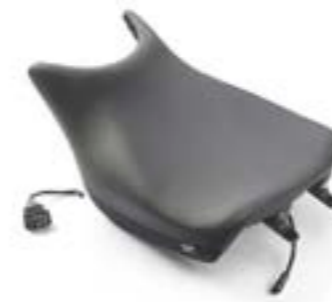
BEHEIZTER, NIEDRIGER FAHRERSITZ (-20MM) A9700612 A9708410