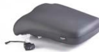
BEHEIZTER SOZIUSSITZ A9708367