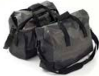
EXPEDITION KOFFER- INNENTASCHEN, WASSERDICHT A9500519