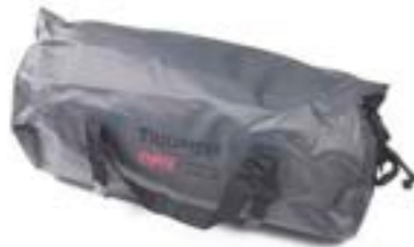
WASSERUNDURCHLÄSSIGE ROLLTASCHE, 40 LITER A9511051