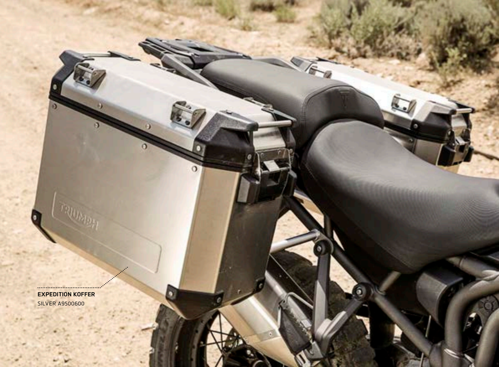
EXPEDITION KOFFER SILVER A9500600

Das Expedition Gepäcksystem ist aus 1,5mm starkem, mit Kunststoffelementen verstärkten, Aluminiumblech gefertigt um die optimale Balance zwischen Haltbarkeit und Gewicht zu erreichen. Das Ein-Schlüssel-System mit Zündschlüssel bietet Ihnen optimalen Komfort. Das komplette System, incl. Top Box, bietet eine Kapazität von 115 Liter.