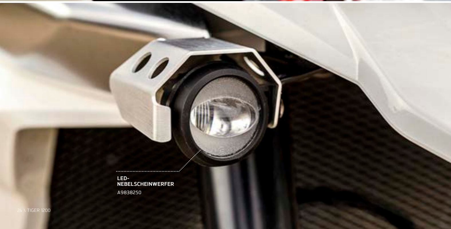
LED- NEBELSCHEINWERFER A9838250