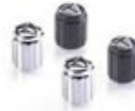
LASERGRAVIERTE VENTILKAPPEN CHROME A2009006 BLACK A2009036