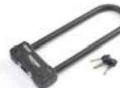
BÜGELSCHLOSS 320 MM A9810024