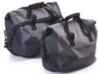
ADVENTURE KOFFER- INNENTASCHEN A9500518