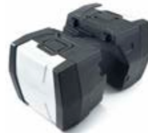
ADVENTURE KOFFER A9508184 A9501270