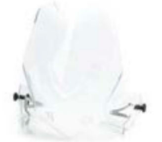
HÖHERE SCHEIBE EINSTELLBAR A9708389