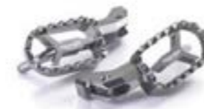
CNC-GEFRÄSTE FUSSRASTEN GRAPHITE GREY A9770038