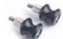
ROULETTES DE BÉQUILLE DE STAND A9640023