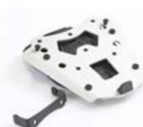
PLATINE DE TOP-CASE EXPEDITION A2353434