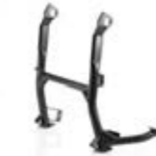
BÉQUILLE CENTRALE A9778062 A9778063