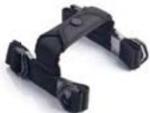
POIGNÉES DE TRANSPORT POUR VALISE EXPEDITION A9500665