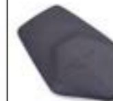
PROTECTION DE RÉSERVOIR EN CAOUTCHOUC A9798028