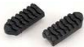
REPOSE-PIEDS EN CAOUTCHOUC A9778032