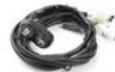
KIT DE MONTAGE DE CONTACTEUR A9828031