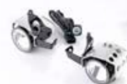
PHARES ANTIBROUILLARD À LED A9830120 A9838029