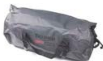
SAC BAUDRUCHE IMPERMÉABLE 40 L A9511051