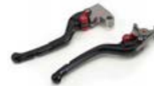
LEVIERS USINÉS A9620086