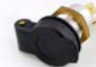
PRISE D'ALIMENTATION AUXILIAIRE A9828005