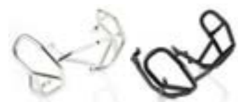
BARRES DE PROTECTION MOTEUR A9780072 A9780090