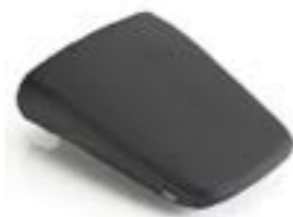
SELLE PASSAGER CONFORT A2309255