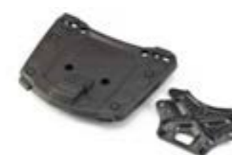
PLATINE DE TOP-CASE A9508148