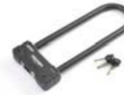
ANTIVOL EN U DE 320 MM A9810024