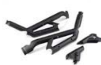
KIT DE PROTECTIONS DE CADRE MOULÉES A9780082