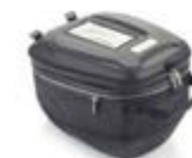
SACOCHE DE RÉSERVOIR À DÉMONTAGE RAPIDE A9510414