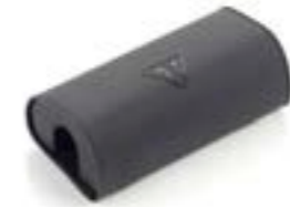
MOUSSE DE GUIDON A9630442