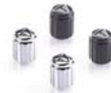
CAPUCHONS DE VALVE – GRAVURE AU LASER CHROME – A2009006 NOIR – A2009036