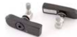
SYSTÈME DE CONTRÔLE DE LA PRESSION DES PNEUS TPMS RESTE DU MONDE – A9640169 JAPON/HONG KONG – A9640056