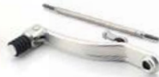
PÉDALE DE CHANGEMENT DE VITESSE PLIABLE A9770036