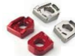
TENDEURS DE CHAÎNE TAILLÉS DANS LA MASSE ROUGE ANODISÉ - A9640046 GRIS GUNMETAL ANODISÉ - A9640158