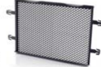
GRILLE DE RADIATEUR A9708280