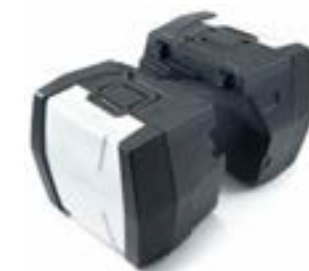
VALISES ADVENTURE A9508184