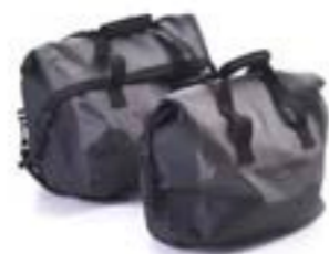
SACS INTÉRIEURS IMPERMÉABLES POUR VALISES EXPEDITION A9500519