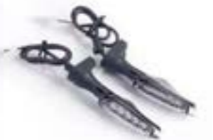
CLIGNOTANTS À LED A2701151