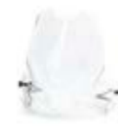
BULLE HAUTE AJUSTABLE A9708248