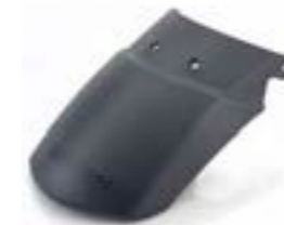
EXTENSION DE GARDE- BOUE AVANT A9708213