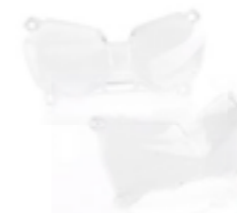
PROTECTION DE PHARE A9838007 A9830108