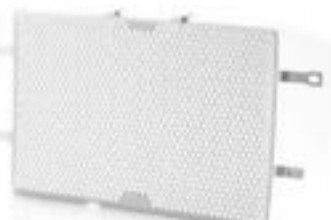
GRILLE DE RADIATEUR ALUMINIUM A9708279