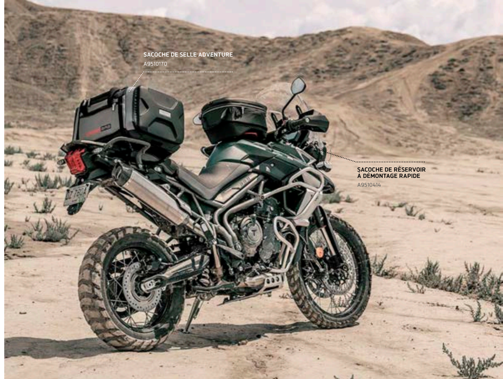
SACOCHE DE SELLE ADVENTURE A9510170