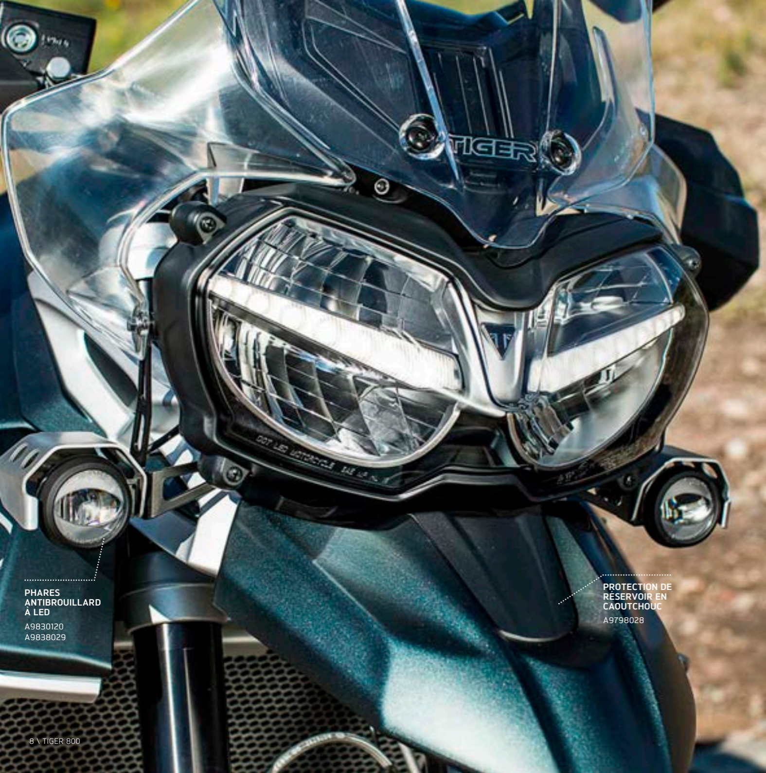
PHARES ANTIBROUILLARD À LED A9830120 A9838029