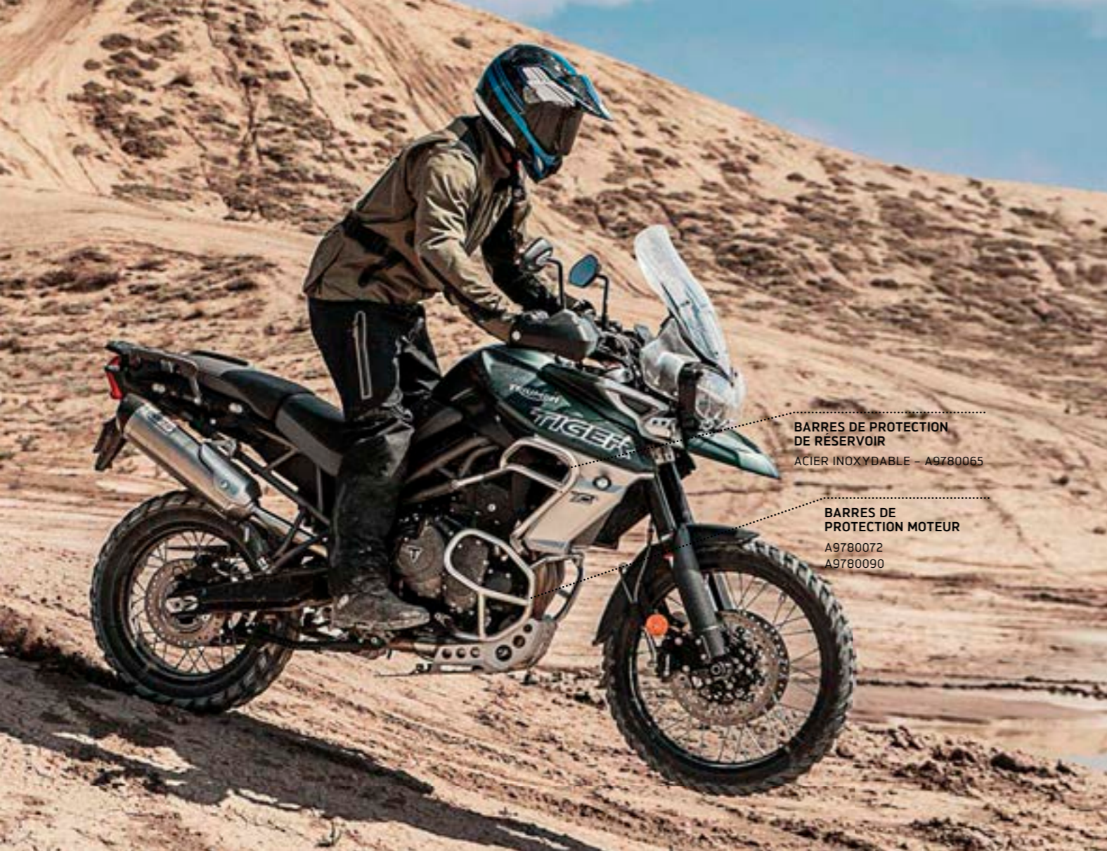
BARRES DE PROTECTION DE RÉSERVOIR ACIER INOXYDABLE – A9780065