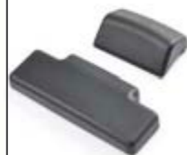
DOSSERETS DE TOP-CASE EXPEDITION A9500532