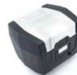
TOP-CASE ADVENTURE T2356829