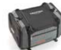
SACOCHE DE SELLE ADVENTURE A9510170