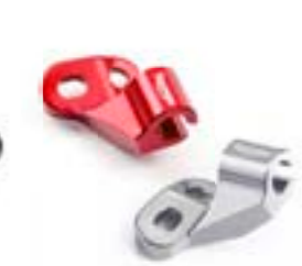
GUIDE DE CÂBLE D'EMBRAYAGE GRIS GUNMETAL ANODISÉ - A9610065 ROUGE ANODISÉ - A9610066