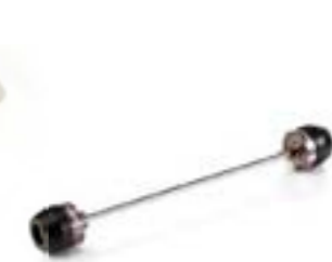
PROTECTIONS DE FOURCHE USINÉES CNC A9640081