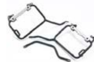
RAILS DE MONTAGE POUR VALISE EXPEDITION A9500726