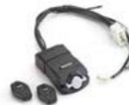
KIT D'ALARME – HOMOLOGUÉ PAR THATCHAM A9808091