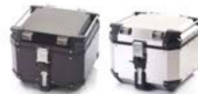
TOP-CASE EXPEDITION ARGENT - A9500530 NOIR - A9500606