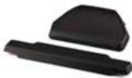
DOSSERETS DE TOP-CASE A9500514