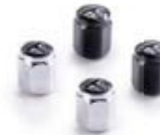
CAPUCHONS DE VALVE – BULLE À LOGO CHROME – A2009007 NOIR – A2009037