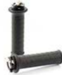
POIGNÉES CHAUFFANTES A9638172