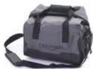
SAC INTÉRIEUR IMPERMÉABLE POUR TOP-CASE EXPEDITION A9500521