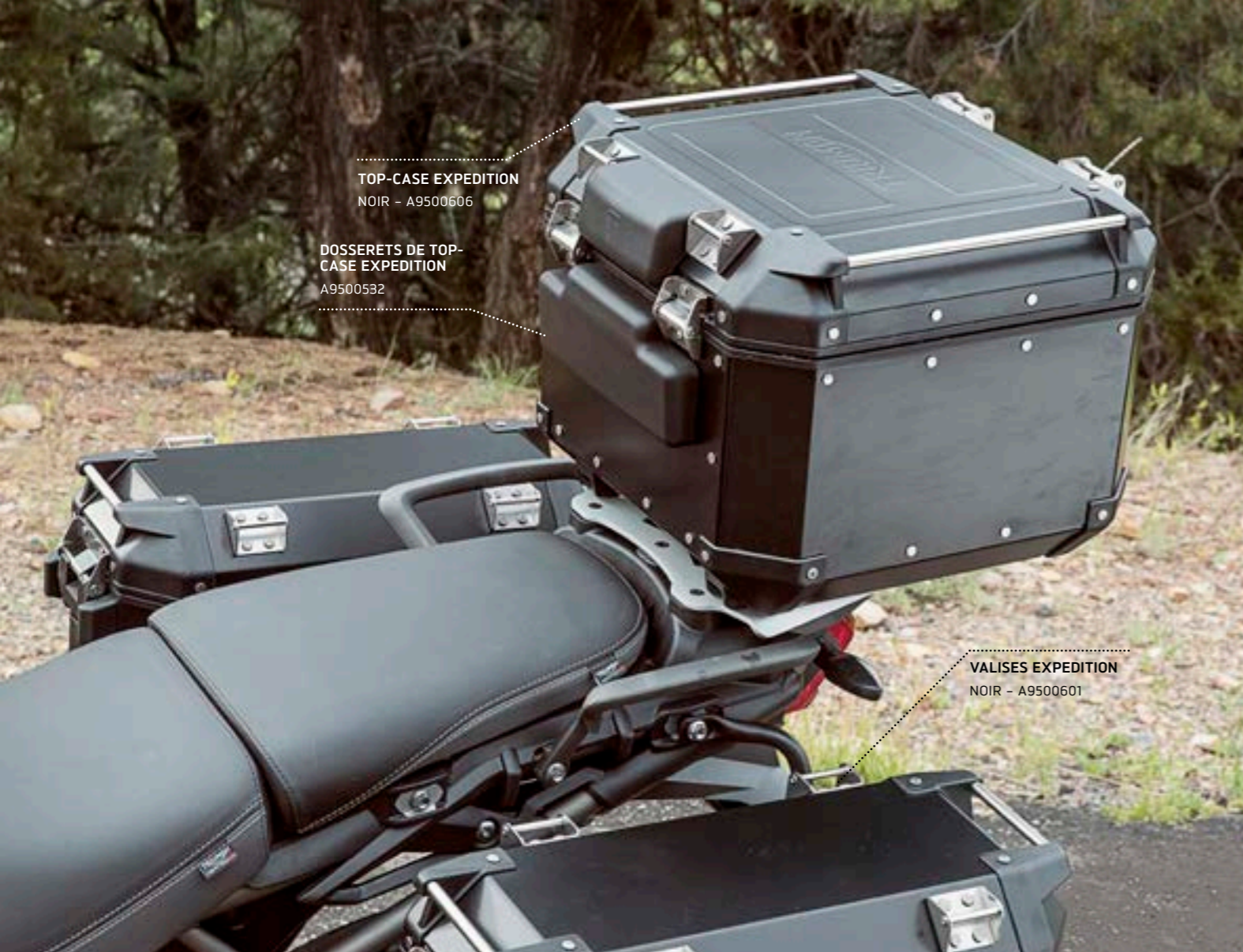
TOP-CASE EXPEDITION NOIR - A9500606