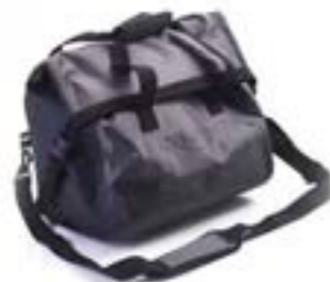
SAC INTÉRIEUR POUR VALISE ADVENTURE A9500522