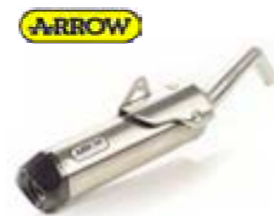
SILENCIEUX SLIP-ON ARROW UE - A9600723 USA - A9600781