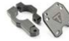
KIT DE MONTAGE GPS A9828035