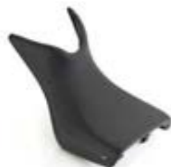
SELLE PILOTE CONFORT A2309254