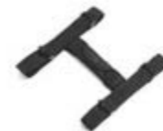
POIGNÉE DE TRANSPORT POUR TOP-CASE EXPEDITION A9500666