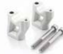
PONTET DE GUIDON A9638167