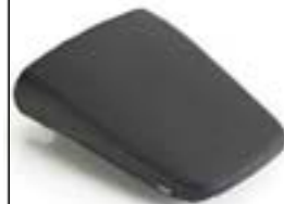
KOMFORT SOZIUSSITZ A2309255