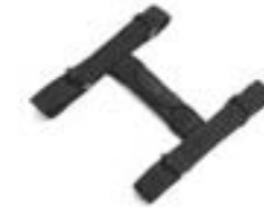
EXPEDITION GEPÄCKBRÜCKE TRAGEGRIF A9500666