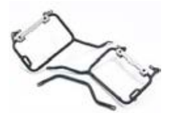
EXPEDITION KOFFER MONTAGESATZ A9500726