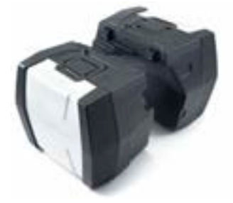
ADVENTURE KOFFER A9508184