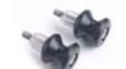
AUFNAHME FÜR MONTAGESTÄNDER A9640023