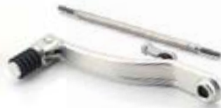
EINKLAPPBARES SCHALTPEDAL A9770036