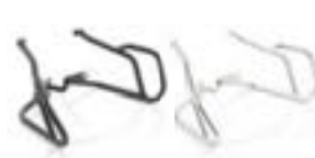
KRAFTSTOFFTANK-SCHUTZBÜGEL BLACK A9780062 EDELSTAHL A9780065