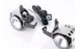
LED-NEBELSCHEINWERFER TIGER 800 A9830120 TIGER 1200 A9838250