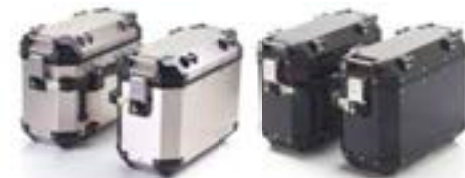
EXPEDITION KOFFER SILVER A9500600 BLACK A9500601

Das Expedition Gepäcksystem ist aus 1,5mm starkem, mit Kunststoffelementen verstärkten, Aluminiumblech gefertigt um die optimale Balance zwischen Haltbarkeit und Gewicht zu erreichen. Das Ein-Schlüssel-System mit Zündschlüssel bietet ihnen optimalen Komfort. Das komplette System, incl. Top Box, bietet eine Kapazität von 115 Liter.