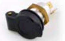
ZUSÄTZLICHE STROMVERSÖRGUNG A9828005