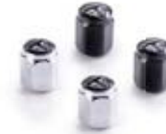
VENTILKAPPEN-RUNDEMBLEM CHROME A2009007 BLACK A2009037