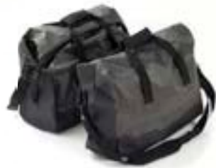
ADVENTURE KOFFER- INNENTASCHEN, PAAR A9500518