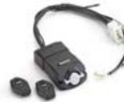
ALARMSATZ - THATCHAM-GENEHMIGT A9808091