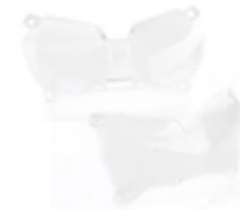
SCHEINWERFER-PROTEKTOR A9838007 A9830108