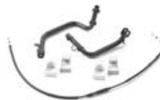
ADVENTURE KOFFER-MONTAGESATZ A9508178