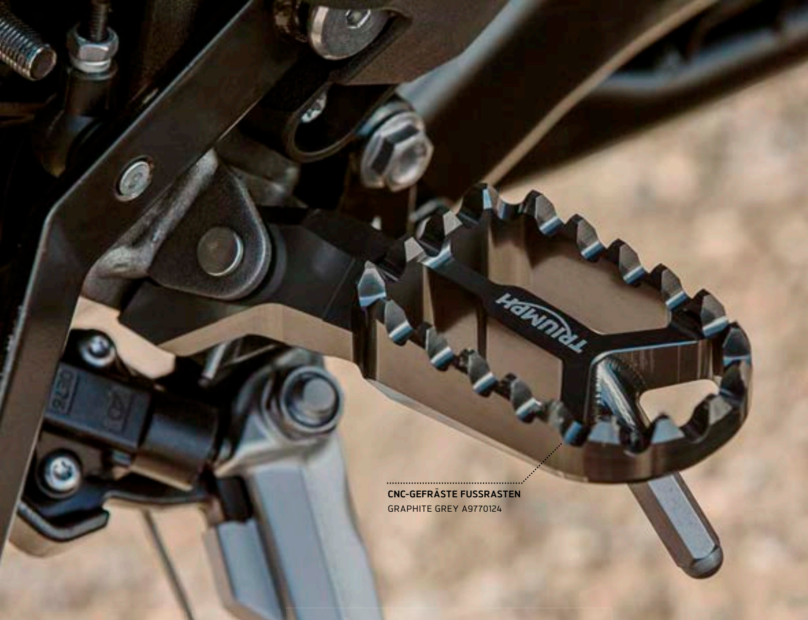
CNC-GEFRÄSTE FUSSRASTEN GRAPHITE GREY A9770124