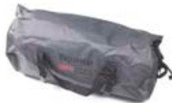
WASSERUNDURCHLÄSSIGE ROLLTASCHE, 40 LITER A9511051