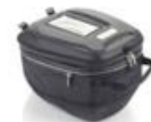
TANKRUCKSACK MIT SCHNELLVERSCHLUSS A9510414