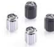
LASERGRAVIERTE VENTILKAPPEN CHROME A2009006 BLACK A2009036