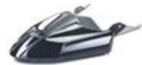
HOCHGEZOGENER KOTFLÜGEL A9708212-##