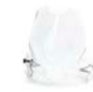
HÖHERE SCHEIBE EINSTELLBAR A9708248