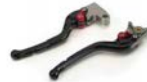
GEFRÄSTE HEBEL A9620086