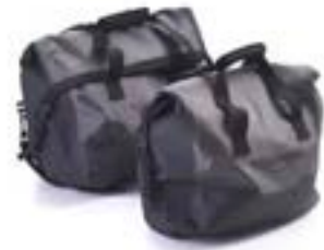
EXPEDITION KOFFER- INNENTASCHEN, WASSERDICHT, PAAR A9500519