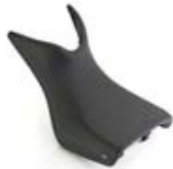
NIEDRIGER KOMFORT- FAHRERSITZ (-20MM) A2309256