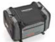
ADVENTURE SITZTASCHE A9510170