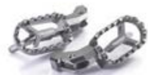
CNC-GEFRÄSTE FUSSRASTEN GRAPHITE GREY A9770124