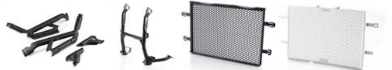
GEGOSSENE RAHMENSCHONER A9780082