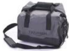
INNENTASCHE ALUMINIUM TOP BOX A9500518