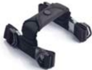
EXPEDITION KOFFER TRAGEGRIFFE A9500665