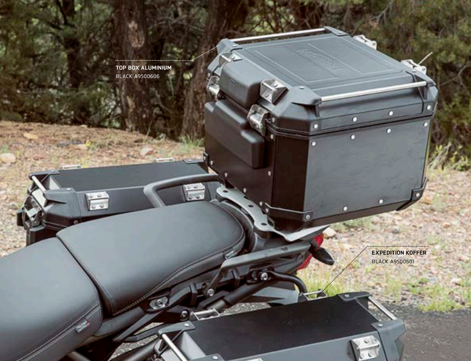
TOP BOX ALUMINIUM BLACK A9500606