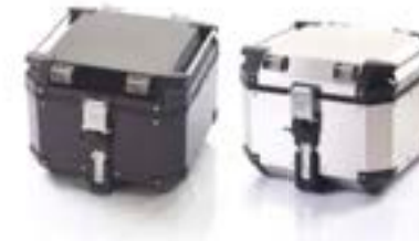
TOP BOX ALUMINIUM SILVER A9500530 BLACK A9500606