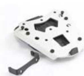
EXPEDITION GLEIT-GEPÄCKBRÜCKE A2353434